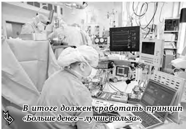
В итоге должен сработать принцип «Больше денег – лучше польза».

В этом году на 1,2 миллиарда рублей увеличено финансирование программы модернизации в части внедрения стандартов медицинской помощи. Стандарт – это обязательный объем