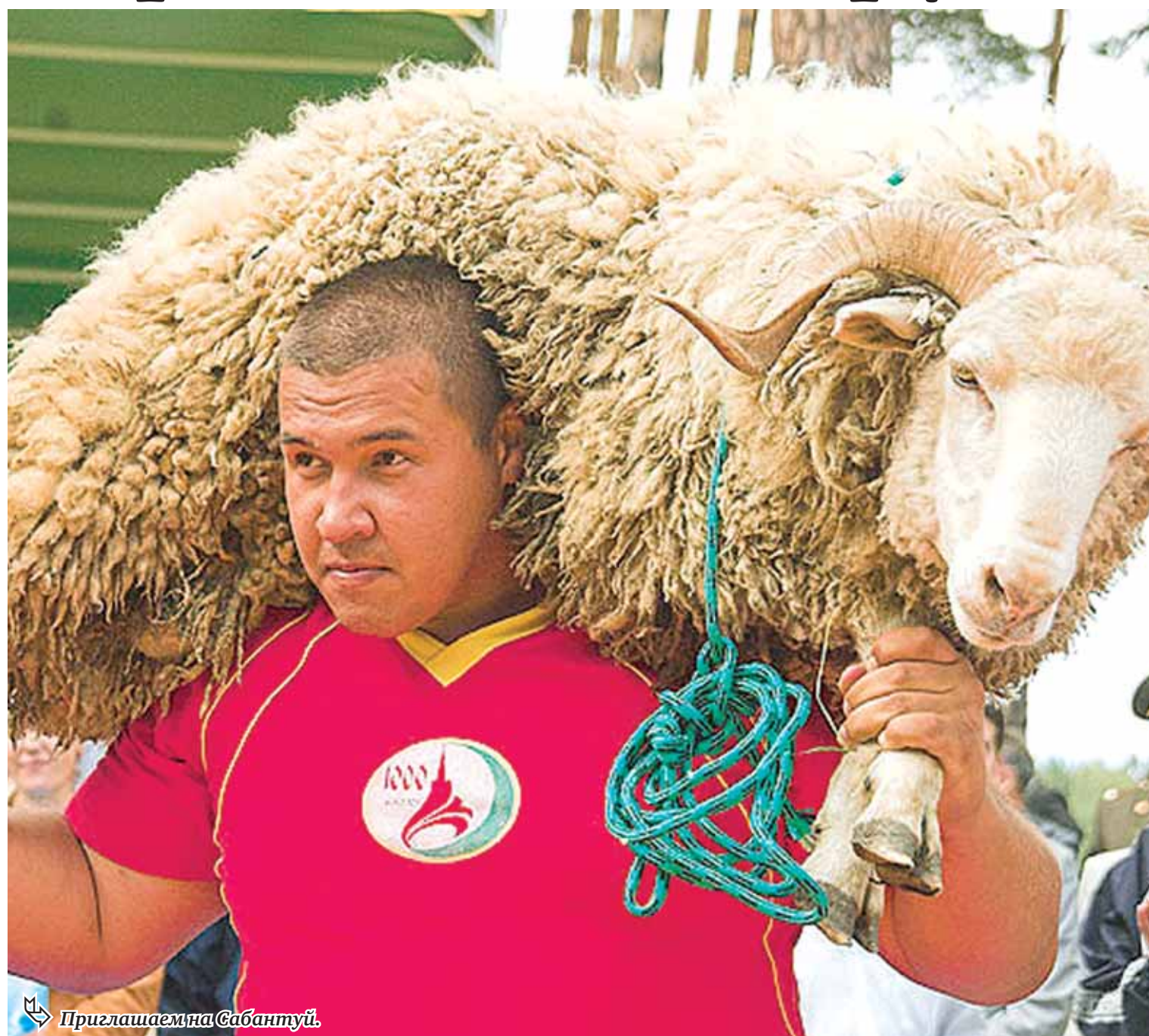
Приглашаем на Сабантуй.