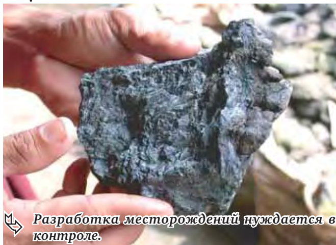
Разработка месторождений нуждается в контроле.

Теперь минпромом начата целенаправленная работа по ревизии ранее выданных лицензий, выявлению допущенных недропользователями нарушений и принятию мер по их устранению. Только за четыре месяца 2012 года направлено 134 уведомления о нарушении лицензионных требований. Количество проведенных за первое полугодие мероприятий выездного контроля превысило показатель за 2011 год более чем в восемь раз. При неустранении нарушений действие лицензий прекращается, освобожденные участки недр подлежат передаче новым недропользователям.