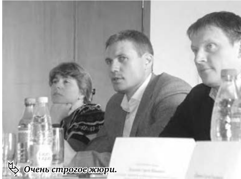
Очень строгое жюри.