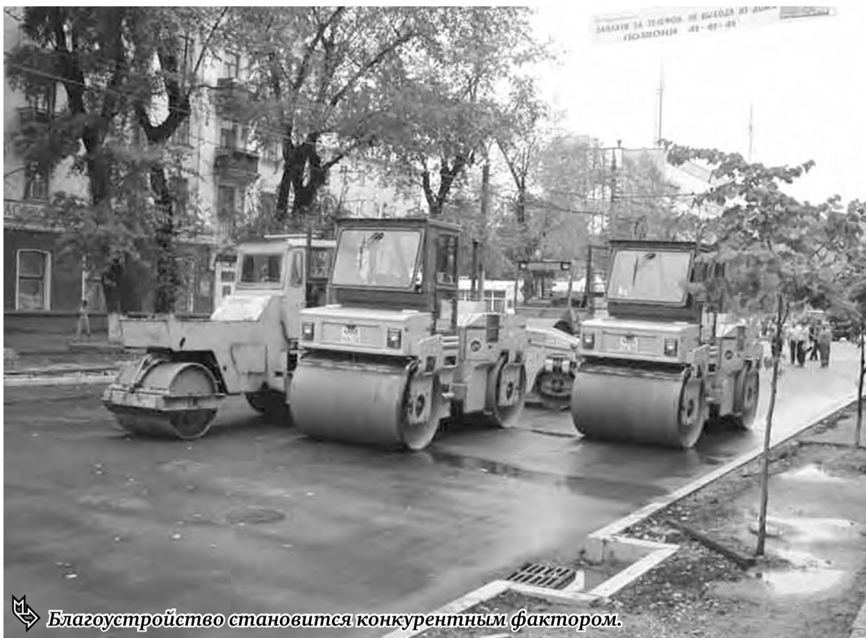
Благоустройство становится конкурентным фактором.

Всем муниципалитетам Южного Урала рекомендовано использовать наработанную базу Челябинска как основу. Причем учитывать этот опыт стоит не только непосредственно в части правил по содержанию территорий, но и в практике взыскания штрафов за нарушения по благоустройству. Глава Челябинска отметил, что