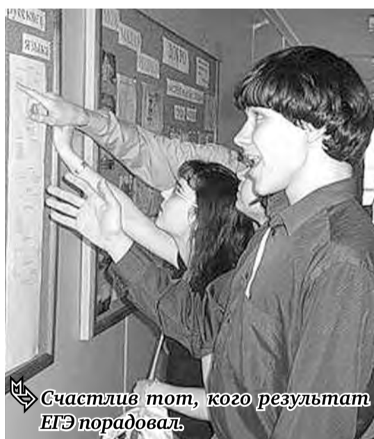
Счастливы тот, кого результат ЕГЭ порадовал