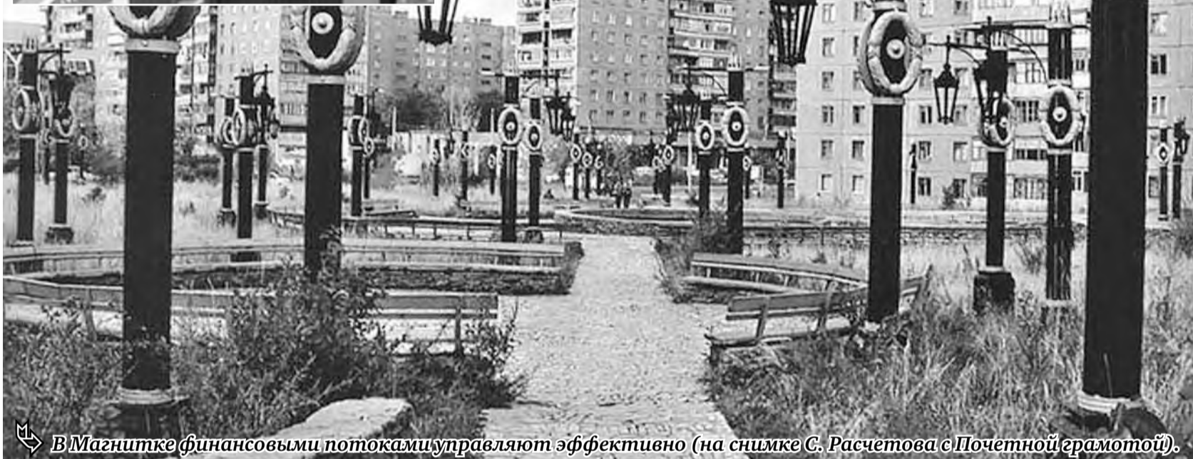
В Магнитке финансовыми потоками управляют эффективно (на снимке С. Расчетова с Почетной грамотой).