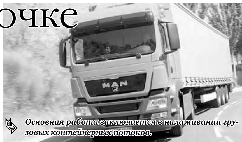
Основная работа заключается в налаживании грузовых контейнерных потоков.

Одним из проектов, реализуемых в рамках соглашения, является строительство в период с 2012 по 2014 годы мультимодального транспортно-логистического комплекса (ТЛК) «Южноуральский» на территории Увельского района Челябинской области. Новый ТЛК – это в первую очередь развитие транспортной инфраструктуры области, порядка двух тысяч рабочих мест, в том числе и для жителей