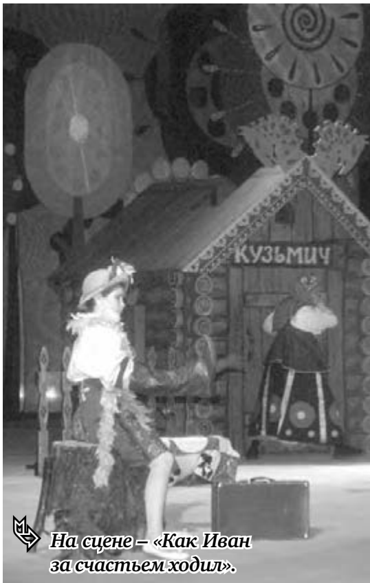
На сцене – «Как Иван за счастьем ходил».

В первый день лета природа подарила теплый, солнечный день, радостный вдвоине, потому что в этот день отмечается Международный день защиты детей.