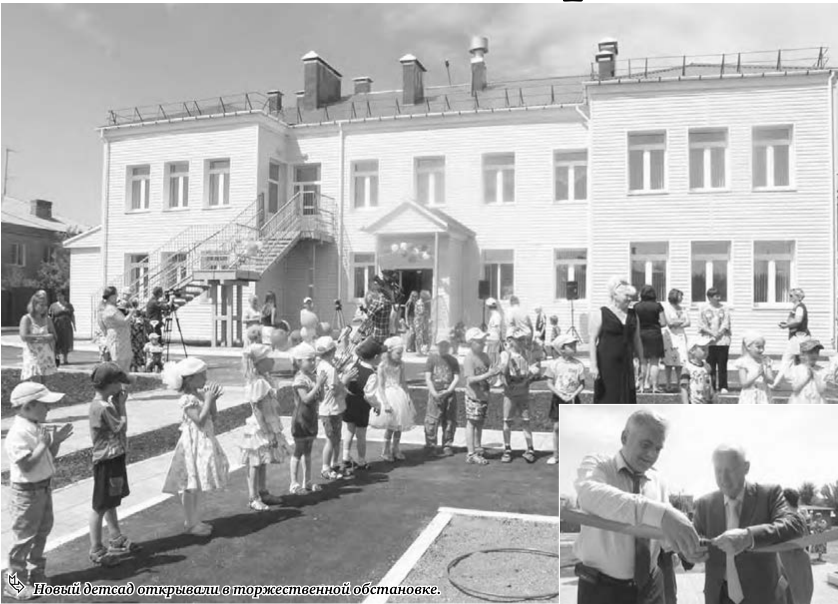
Новый детсад открывали в торжественной обстановке.