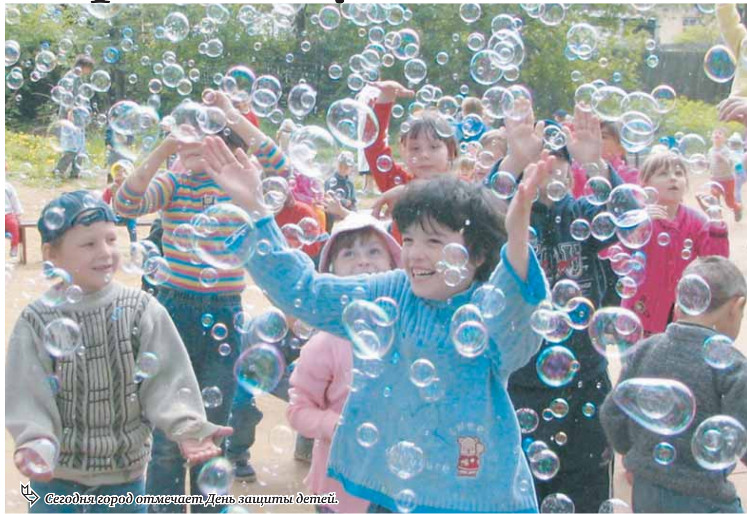
Сегодня город отмечает День защиты детей.