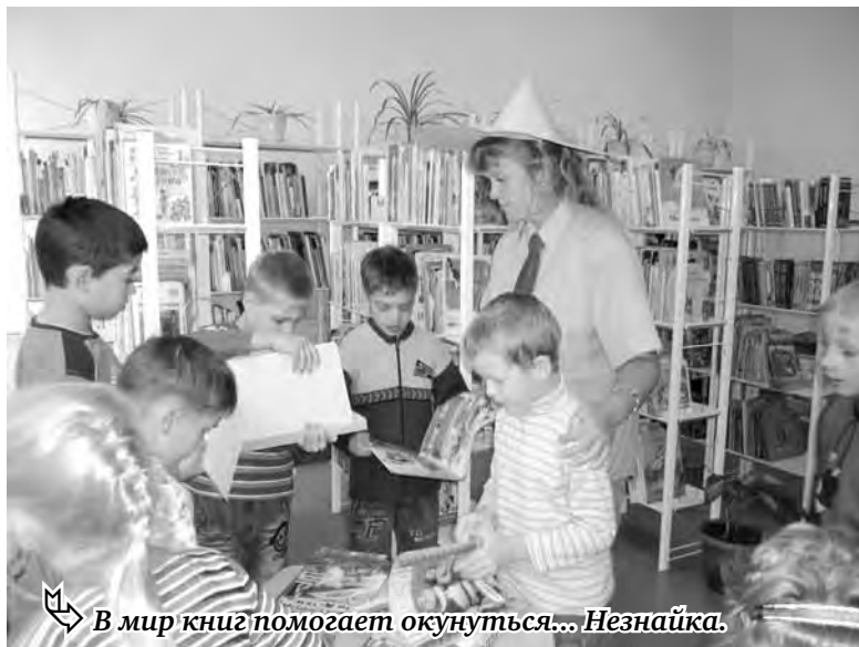
В мир книг помогает окунуться... Незнайка.