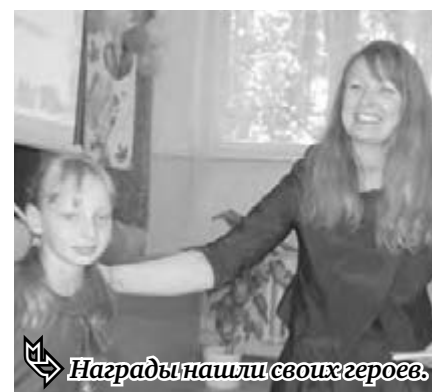
Награды нашли своих героев.

Ныне традиция продолжилась. В актовом зале школы собрались лучшие педагоги, лучшие учащиеся и лучшие родители. С приветственными словами