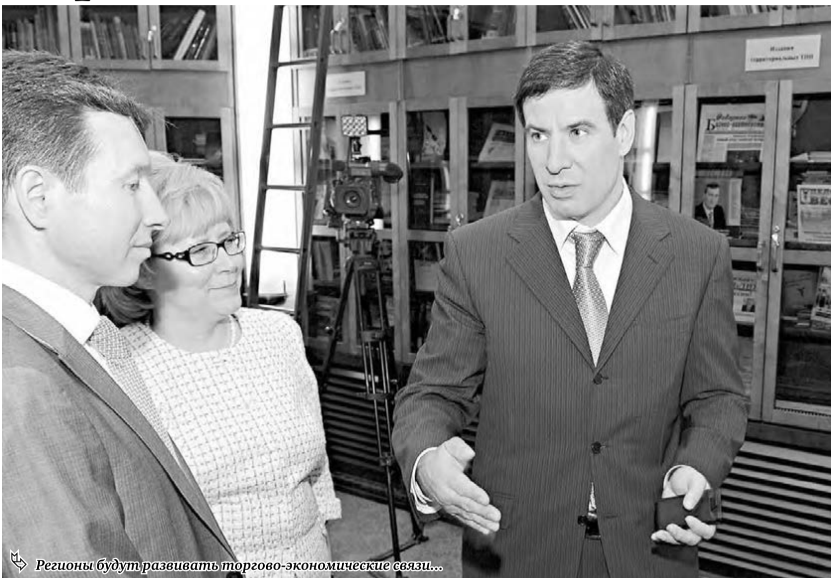
Регионы будут развивать торгово-экономические связи...