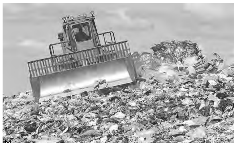
Стихийные свалки – народное явление в районах области.

микробного загрязнения почвы превышает средний областной показатель – 9,2 процента. Так, в Сатке он составляет 26,6 процента, в Южноуральске – 20 процентов.