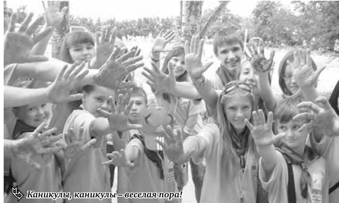
Каникулы, каникулы – веселая пора!