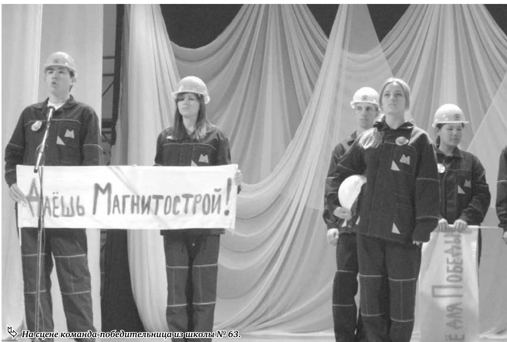
На сцене команда-победительница из школы № 63.