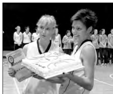
• Награду принимает «Магнитка»

– Вспомнила свою молодость, те времена, когда сама профессио-