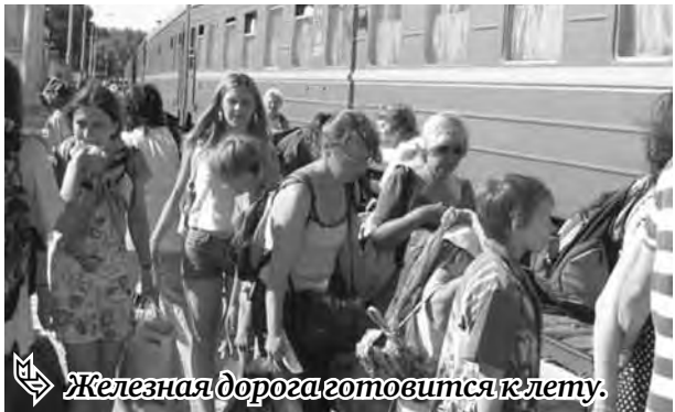
Железная дорога готовится к лету.

Начнет действовать 5-процентная скидка при покупке билетов через Интернет в вагоны класса «люкс», СВ и купейные вагоны на поезда дальнего следования во внутрисударственном сообщении. Технология продажи проездных документов через Интернет была внедрена в мае 2007 года. В настоящее время продажа электронных билетов составляет 11,3 процента от общего количества мест, реализованных в целом по сети железных дорог.