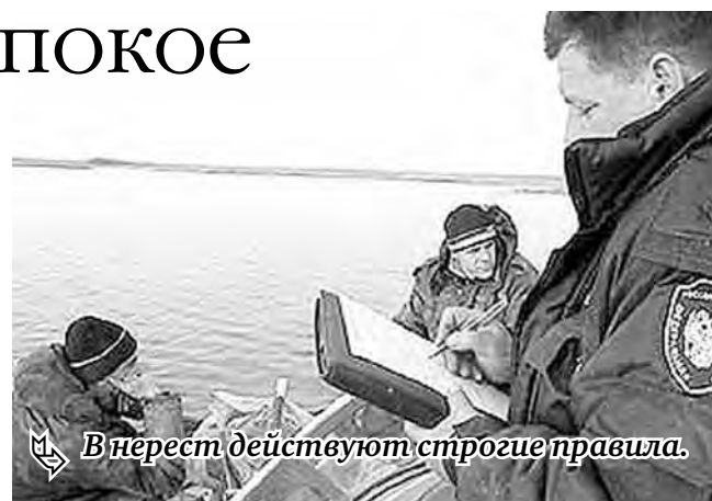
В нерест действуют строгие правила.

Рыбаков, которые не подчиняются общим правилам, ждут штрафы от одной до двух тысяч рублей. Браконьерам придется еще ту же: они рискуют попасть под уголовную ответственность при вылове рыбы на электроудочку или сетью. Добавим, что за незаконно выловленную рыбу предъявляются иски. Они рассчитываются в соответствии с причиненным ущербом, исходя из стоимости одного экземпляра: