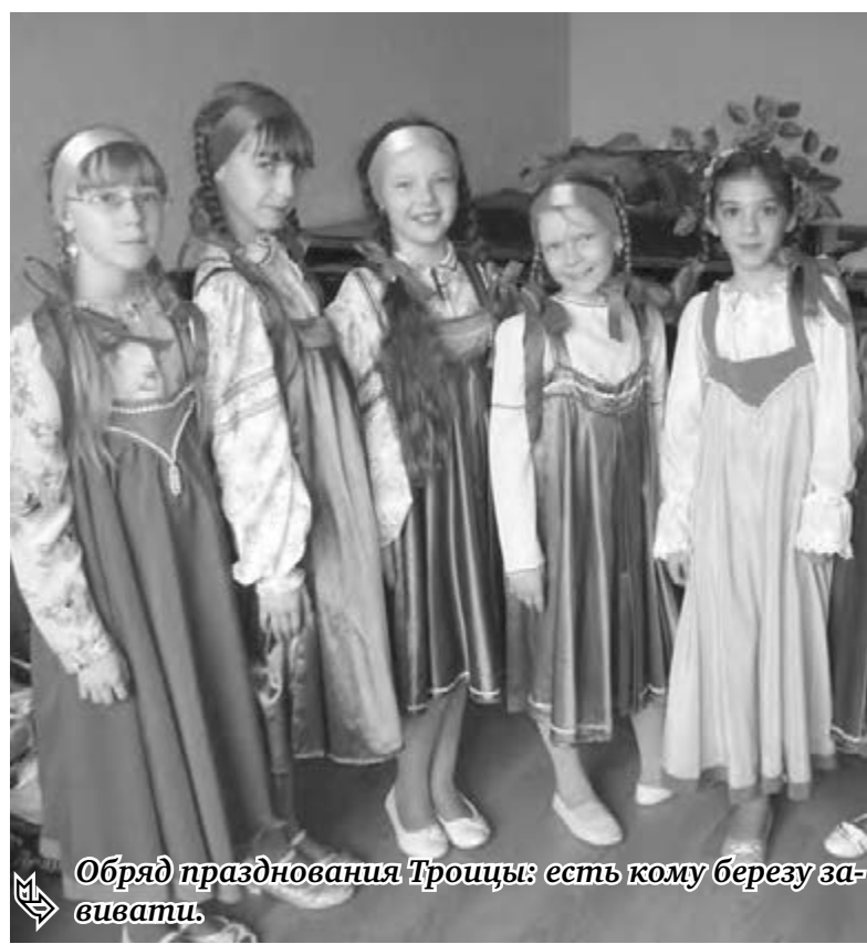
← Обряд празднования Троицы: есть кому березу завивать.