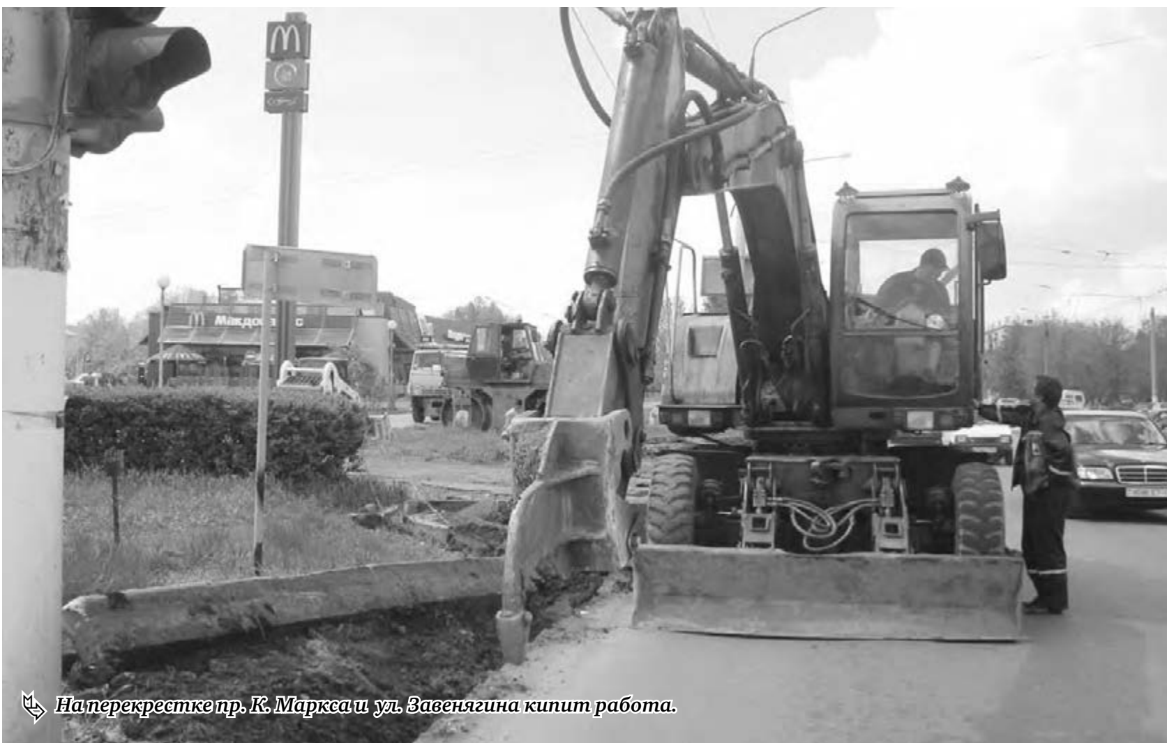
На перекрестке пр. К. Маркса и ул. Завенягина кипит работа.