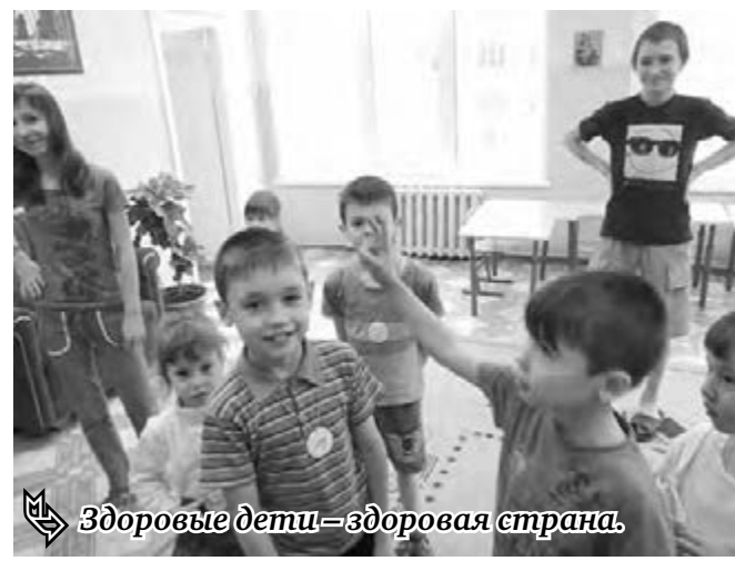
Здоровые дети – здоровая страна.

Глава региона также напомнил, что в соответствии с федеральным законодательством