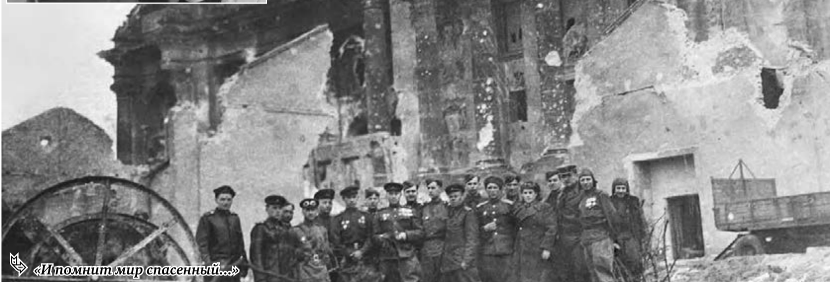
«Исполнит мир спасенный...»