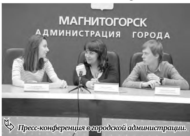
Пресс-конференция в городской администрации.

«Свечи Памяти. Свечи Победы» – так назвали организаторы, придуманный ими ритуал. В пресс-конференции приняли участие председатель