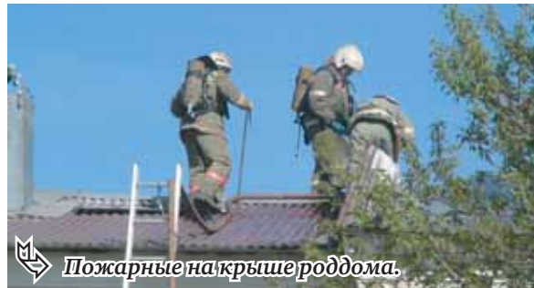
Пожарные на крыше роддома.

За минувшие выходные в Магнитогорске зарегистрировано восемь пожаров.