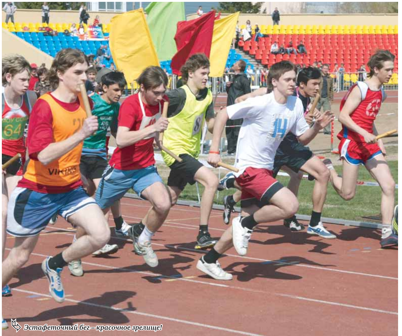
Эстафеточный бег – красочное зрелище!