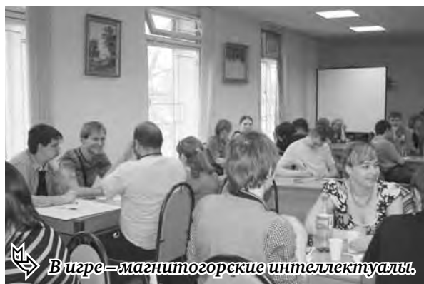
В игре – магнитогорские интеллектуалы.

по 12 вопросов. Выигрывает команда, которая наберет наибольшее количество баллов. Прозвучавшие в игре вопросы были из различных областей знаний, например: «Когда этот певец учился в школе, одноклассники в шутку коверкали его фамилию, с намеком на некую валюту, сам певец своей фамилией остался доволен: «Несмотря на то, что я грек, и в корне моей фамилии звучит «икс». Напишите фамилию этого певца». На обсуждение давалась минута, за это время нужно