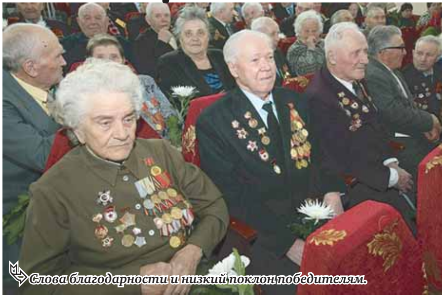
Слова благодарности и низкий поклон победителям.