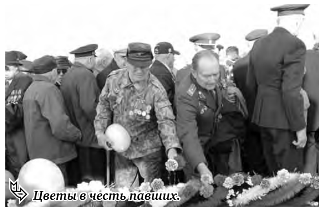
Цветы в честь павших.

школах города: №8, 48, 56 и 59 начнутся праздничные мероприятия. Как всегда, школьники подготовят для своих гостей, – а ими станут заслуженные люди, живущие в районах, ветераны труда, фронтовики – праздничный концерт с поздравлениями. Затем в центр города автобусы от разных организаций начнут привозить ветеранов. В 10 часов у монумента «Тыл и фронт» состоится митинг и возложение венков к главным городским святыням. Здесь же школьники будут прикалывать ветеранам символ Победы – георгиевскую ленту и вручать цветы. После чего все желающие могут отправиться на городские кладбища и посе-