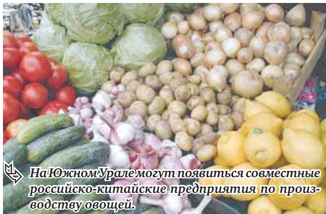
На Южном Урале могут появиться совместные российско-китайские предприятия по производству овощей.

Сегодня сотрудничество в сфере сельского хозяйства с Китаем представлено, в основном, использованием дешевой рабочей силы и допотопных технологий выращивания овощей. Между тем Китай занимает первые позиции в мире по выращиванию различных сельскохозяйственных культур, активно внедряет современ-