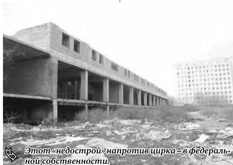
Этот «недострой» напротив цирка – в федеральной собственности.

Вообще же управление архитектуры и градостроительства ведет постоянный мониторинг земельных участков с незавершенным строительством с тем, чтобы городская земля не была простым способом вложения денег или укрыательства от налогов. Так, к примеру, происходит в частном секторе. Частник может вообще не строить дом, и земля будет пустовать, потому что денег на строительство у него нет, а продать участок жалко. А может строить свой дом годами. И при этом даже преспокойно проживать