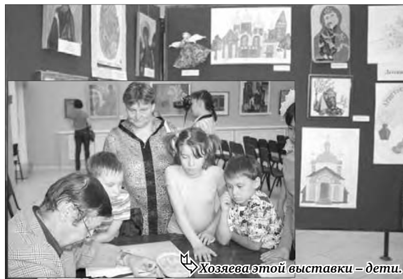
Хозяйка этой выставки – дети.