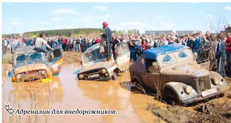
Адреналин для внедорожников.

К соревнованиям допускаются участники на любых легковых автомобилях с колесной формулой 4X4, соответствующих категории «В» классификации РФ. Все владельцы внедорожников, желающие принять участие в битве «Первая грязь – 2012», могут обратиться в оргкомитет по телефону 45-21-49. Организатор соревнований – некоммерческое объединение «MAGWD» (Магнитогорское внедорожное движение) обещает зрителям и участникам хорошее настроение, интересную трассу и море эмоций.