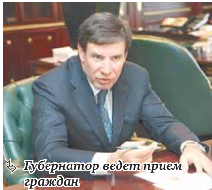
Губернатор ведет прием граждан

Когда будет организован следующий подобный прием, пока неизвестно. Но в