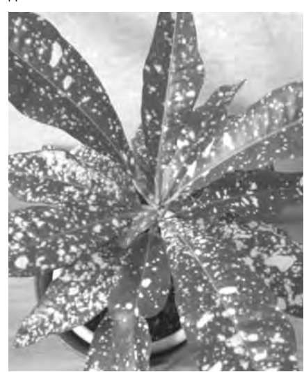
Подготовила Лидия ГРАНИШЕВСКАЯ.

– Поставьте вашу «пальму» ближе к свету и на влажный керамзит. С оголившимся стволом уже сделать ничего нельзя, но оставшиеся листики можно спасти. Вашему растению просто не хватает света. Прищипните макушку, и он даст новые веточки и листочки.