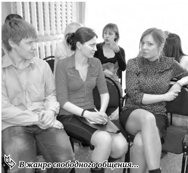
В жанре свободного общения...