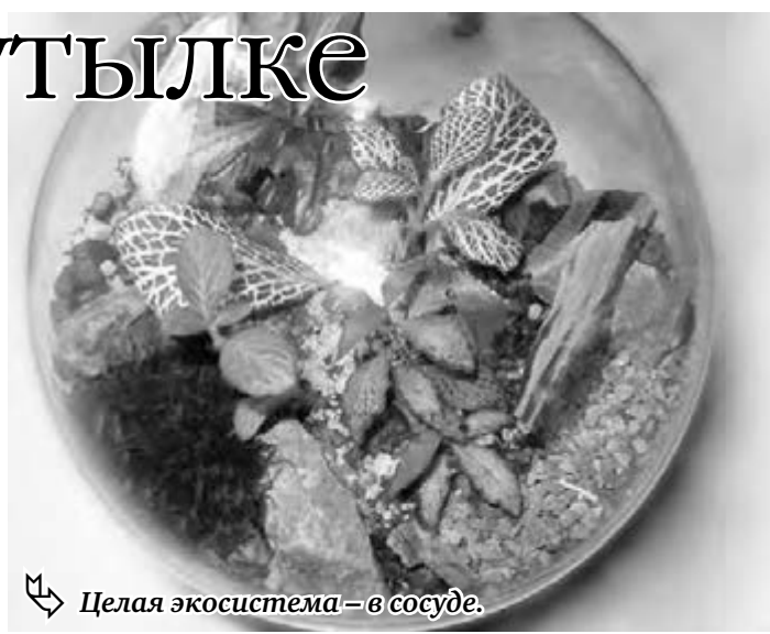
Целая экосистема – в сосуде.

Самое большое преимущество флорариумов в том, что в стеклянной емкости создается благоприятный микроклимат с повышенной влажностью. Флорариум функционирует по принципу автономной экологической системы, для контроля за температурой и влажностью оборудуется термометром и гигрометром, а также системой вентиляции и дополнительной подсветкой.