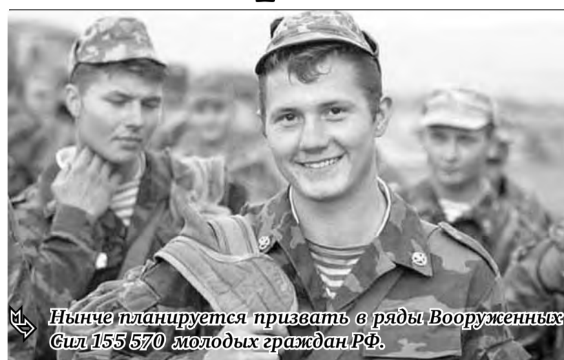
Ныне планируется призвать в ряды Вооруженных Сил 155 570 молодых граждан РФ.

Еще одной особенностью весеннего призыва он назвал «уточнение порядка предоставления отсрочки от призыва на военную службу аспирантам». Таковыми пользуются те из них, кто обучается по программам послевузовского профессионального