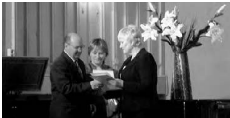
• Почетную грамоту вручает глава района.

В большом зале Магнитогорской государственной консерватории состоялось торжественное мероприятие, посвященное юбилею ветеранского движения Правобережного района. За четыре с половиной десятилетия работы Правобережному совету ветеранов пришлось многое пережить. Шло время, менялись руководители, изменился даже строй, но ориентиры ветеранского движения во все годы оставались неизменными. Движение с момента его зарождения объединяло энергичных, неравнодушных людей с активной жизненной позицией, готовых помогать пожилым и заботиться о них.