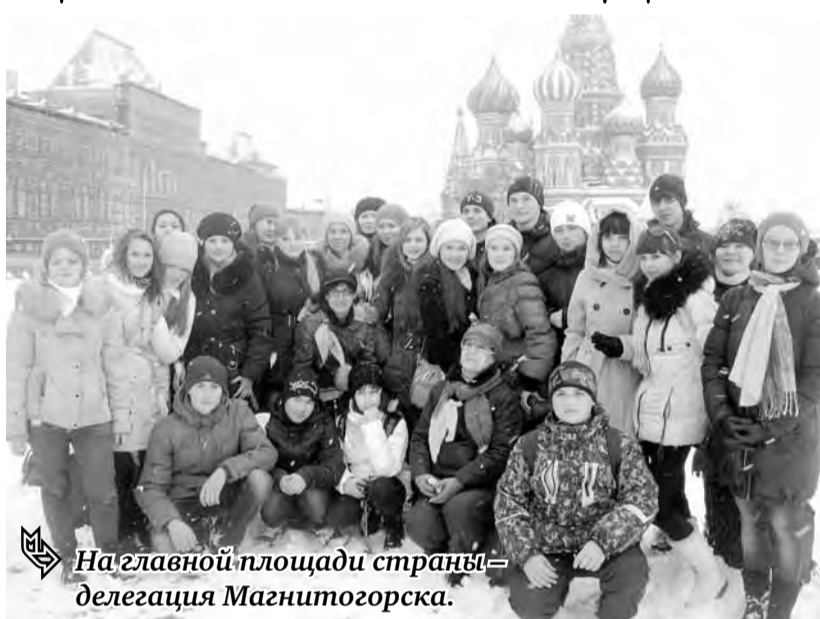
На главной площади страны – делегация Магнитогорска.

Чтобы попасть на интеллектуальное соревнование такого масштаба, двадцать шесть магнитогорских вундеркиндов выдержали острую борьбу на своих школьных конференциях, потом стали победителями и призерами городской конференции «Мыслители, искатели 21 века», затем – лауреатами заочного тура всероссийской конференции. И только потом, получив вызов-приглашение, смогли поехать «за тридевять земель», чтобы показать свои таланты перед столичным жюри. После долгой дороги в поезде, где ребята смогли поближе познакомиться друг с другом, Красная площадь показала им настоящей сказкой – с красивейшими куполами Василия Блаженного, классически строгими пропорциями Исторического музея, боем кремлевских курантов. Именно с главной площади России, в сопровождении полицейских мигалок, и отправились большой колонной восемнадцать крупногабаритных «Икарусов», заполненных детьми со всех уголков России, в детский дом отдыха управления делами президента РФ «Непецино». Там должна была состояться первая сессия Всероссийской конференции обучающихся VI ежегодного Всероссийского конкурса достижений талантливой молодежи «Национальное достояние России». После