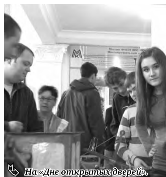
На «Дне открытые дверей».

у работодателей востребовано. Для выпускников многопрофильного колледжа будет предусмотрено предварительное трудоустройство.