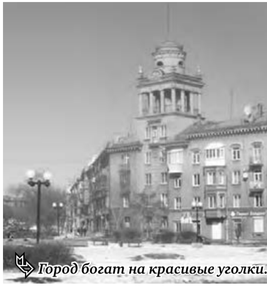
Город богат на красивые уголки.

Между тем сегодня в городе проводятся общественные слушания по обсуждению проекта Правил благоустройства и озеленения Магнитогорска. В этих Правилах впервые появился пункт, который гласит: «Изменения фасадов зданий, связанные с ликвидацией или изменением отдельных деталей, а также устройством новых и реконструкция существующих оконных и дверных проемов, выходящих на главный фасад, следует производить по согласованию с администрацией города». Именно этого, как утверждает главный архитектор города, они давно добивались. С принятием Правил, наконец-то, «самодеятельность» некоторых лиц можно будет свести на нет. Тем более что и Федеральный Закон «Об основах федеральной жилищной