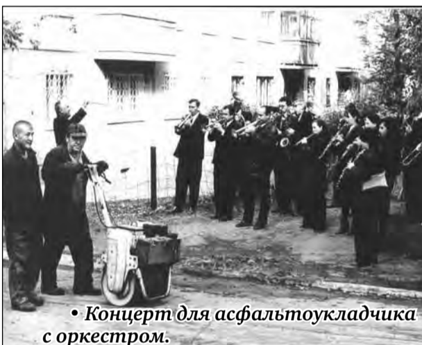
• Концерт для асфальтоукладчика с оркестром.