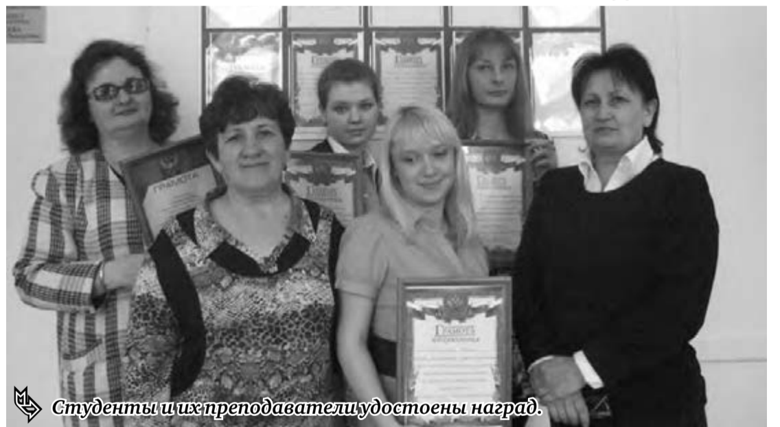
Студенты и их преподаватели удостоены наград.

– Работа над проектами вызвала у наших студентов некоторые трудности, так как интегрированный метод обучения для дошкольных учреждений является инновационным, – рассказывает