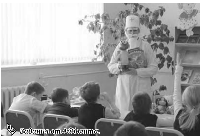
Задания от Айболита.

Михалкову – 99! Специально к этой предъюбилейной дате сотрудники библиотеки подготовили и провели масштабное мероприятие – экскурсию «Добро пожаловать к Михалкову». Именно этими словами под звуки фанфар хозяйка библиотеки встречала своих маленьких гостей. Юным читателям представилась еще одна отличная возможность посетить теперь уже именную библиотеку и открытый в ней музей С.В. Михалкова, познакомиться с редкими раритетными изданиями книг писателя, сфотографироваться на память с дядей Степой, словно сошедшим с книжной страницы, а также своими глазами увидеть заветную подпись,