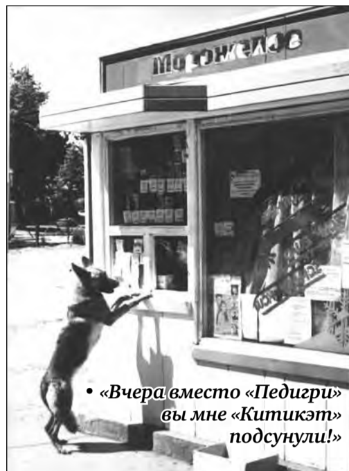
• «Вчера вместо «Педигри» вы мне «Китикэт» подсунули!»