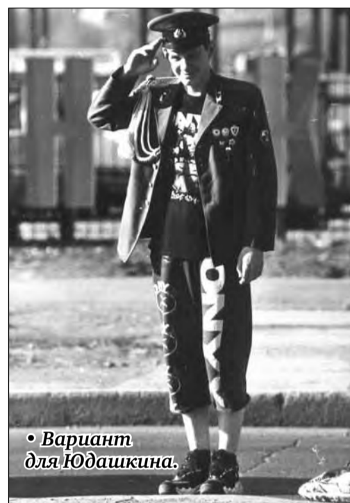
• Вариант для Юдашкина.

Имя Анатолия КНЯЗЕВА в городе хорошо известно. В канун 1 апреля мы решили опубликовать несколько фотографий, сделанных им в разное время и по разным поводам. Общее у них одно – веселое отношение к подмогновенным мгновениям нашей жизни. А чего