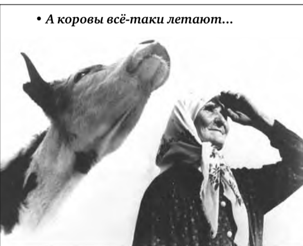
• А коровы всё-таки летают...