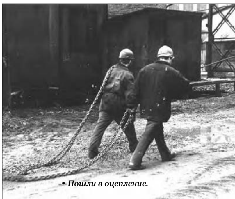
• Пошли в оцепление.