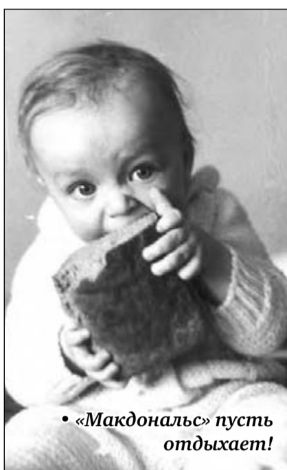
• «Макдональдс» пусть отдыхает!

еще ждать от много повидавшего мастера к Дню смеха? Кстати, предлагаем читателям включиться в процесс сочинения подписей к этим снимкам. Озвучьте ваши варианты названий, начиная прямо с понедельника, по телефону 26-04-75.