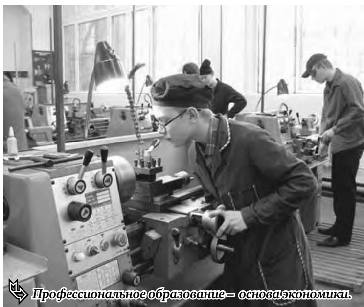
Профессиональное образование – основа экономики.

Одним из последних нововведений этого года является запрет на пересдачу экзамена для школьников, нарушивших порядок проведения ЕГЭ. Возможность повторного прохождения экзамена предоставляется ученикам, получившим неудовлетворительную оценку по одному предмету, а также тем, кто не завершил выполнение экзаменационной работы по уважительной причине.