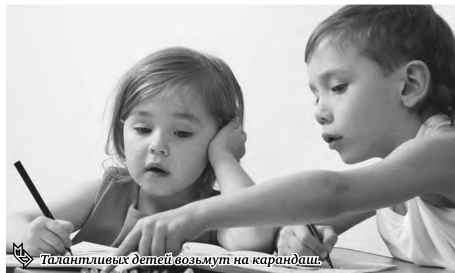
Талантливых детей возьмут на карандаш.

Одаренные дети области будут учиться в Челябинске.