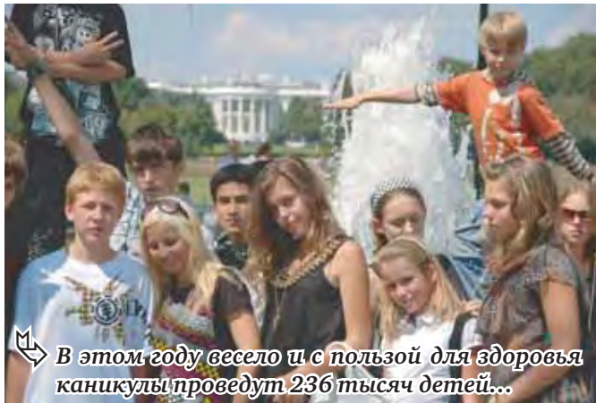
В этом году весело и с пользой для здоровья каникулы проведут 236 тысяч детей...

Как сообщили в пресс-службе главы региона, в настоящий момент на Южном Урале действуют различные программы, регулирующие отдых, оздоровление и развитие детей разных категорий и социального статуса. Министрством образования и науки Челябинской области утверждена ведомственная целевая программа «Органи-