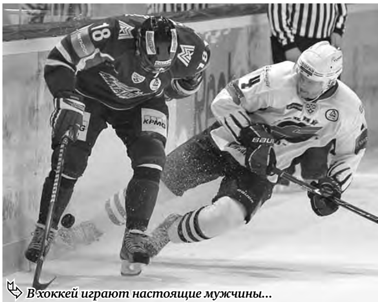
В хоккее играют настоящие мужчины...

Хотелось бы, чтобы в следующем году по такому же принципу проводились серии первого раунда. От этого выиграют все, а в первую очередь