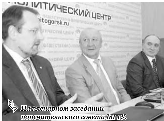
На пленарном заседании попечительского совета МГТУ.