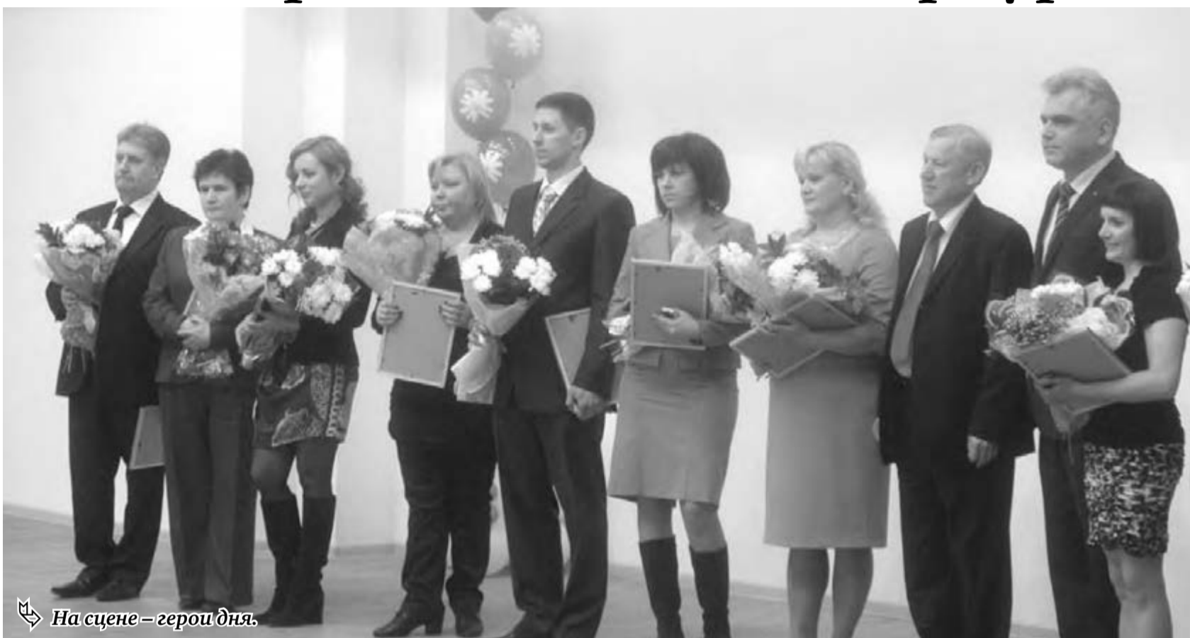
На сцене – герои дня.