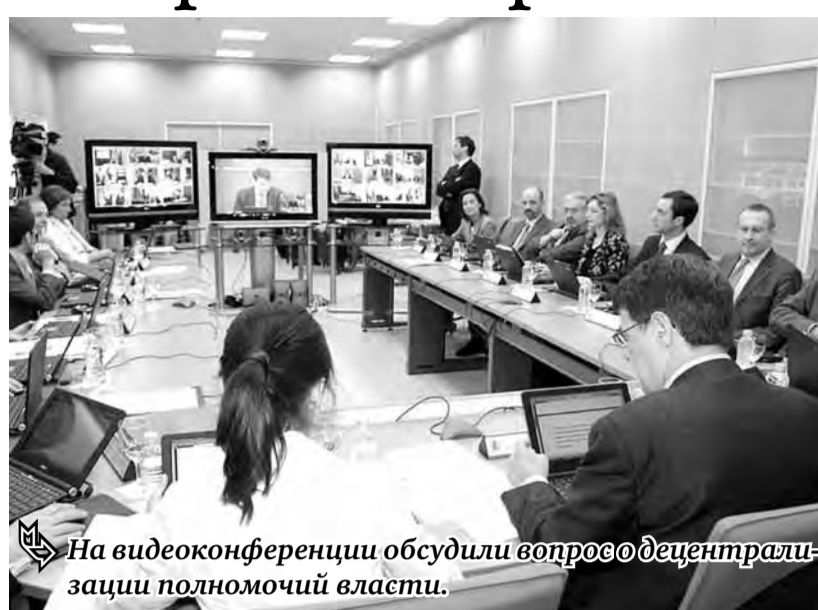
На видеоконференции обсудили вопросы децентрализации полномочий власти.

Глава Южного Урала подчеркнул, что есть ряд направлений, где передача полномочий не требует крупных затрат. Но при этом повлечет улучшение инвестиционного климата, рост собственных доходов субъектов РФ. Это, в частности, касается земельных участков, находящихся в федеральной собственности.