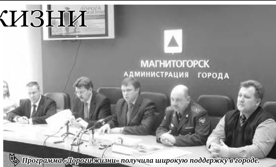
Программа «Дороги жизни» получила широкую поддержку в городе.

Цели проекта понятны для всех жителей города, являющихся участниками дорожного движения, – это безопасность каждого из нас. Стоит отметить, что проект никоим образом не подменяет существующие региональные, городские, федеральные программы безопасности дорожного движения, он только расширяет их сферу и по некоторым позициям дополняет. К примеру, одной из целей «Дороги жизни» является отстаивание прав граждан на безопасность дорожного движения. Как пояснили организато-