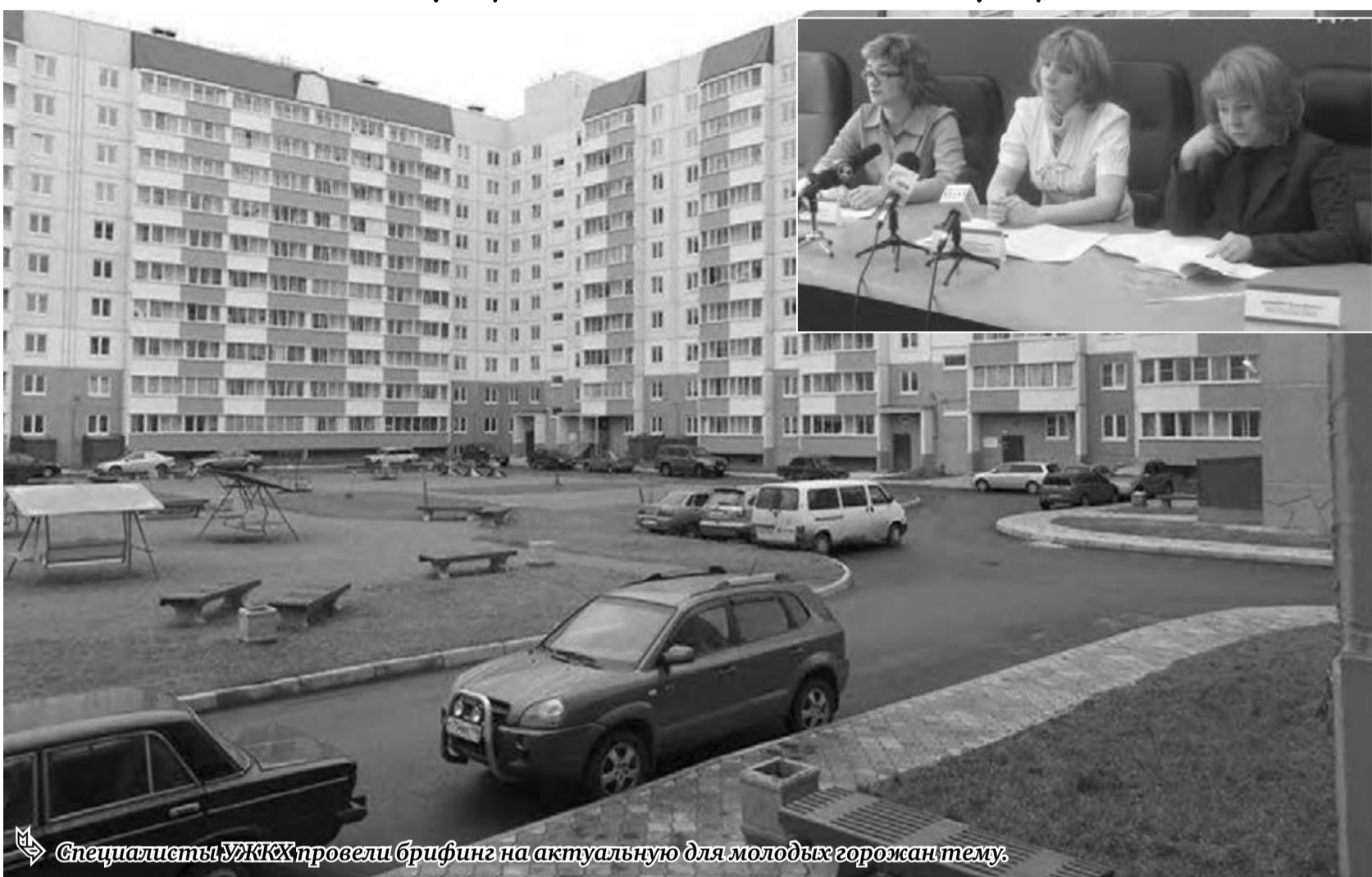
Специалисты УЖКХ провели брифинг на актуальную для молодых горожан тему.