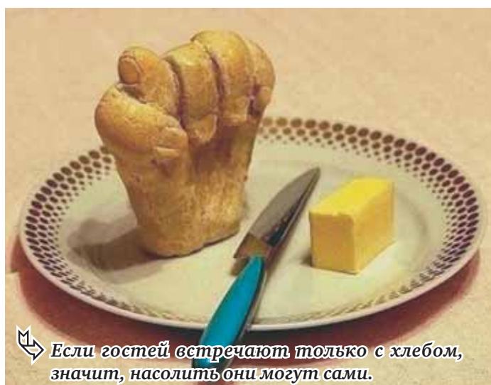
Если гостей встречают только с хлебом, значит, насолить они могут сами.