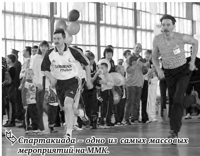
Спартакиада – одно из самых массовых мероприятий на ММК.

По программе летней и зимней спартакиад среди работников и руководителей проведены соревнования по 16 видам спорта, в которых участвовали три с половиной тысячи человек, при этом рост показателям 2010 года составил 28,7 процента. Работники и члены их семей более 88 тысяч раз посетили аквапарк «Водопад чудес», что на 26,2