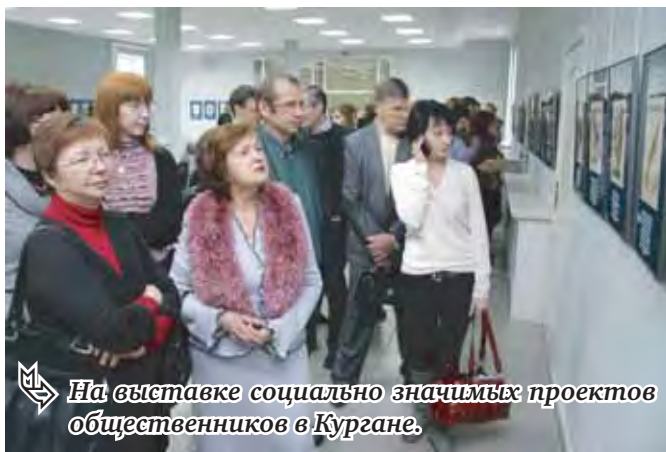
На выставке социально значимых проектов общественников в Кургане.

«Челябинскую область на выставке в числе прочих организаций представляли Центр патриотического воспитания «Росток» и региональный молодежный культурный центр «Пчёлочка золотая» – именно их проект привлек внимание полпреда президента РФ Сергея Сметанюка», – говорится в сооб-