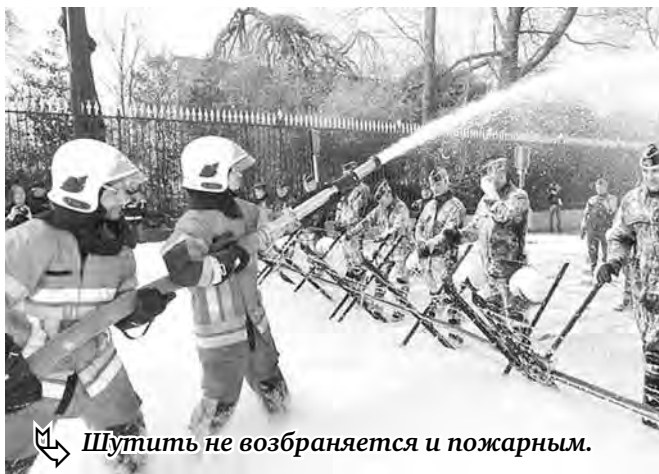
Шутить не возбраняется и пожарным.