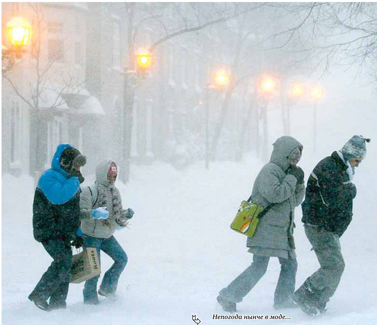
Непогода нынче в моде...