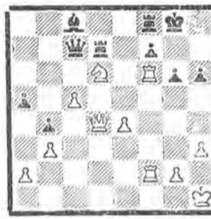
Фишдик — Приль

этого турнира. Белые: Kph1, Fd4, Lf2, Lf6, Kd6, a2, b3, c5, e4, g2, h3 (всего 11 фигур).