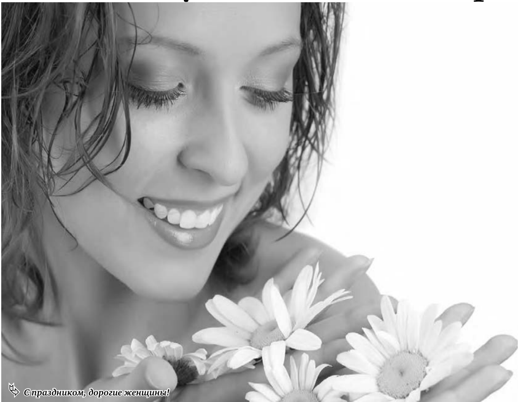
С праздником, дорогие женщины!