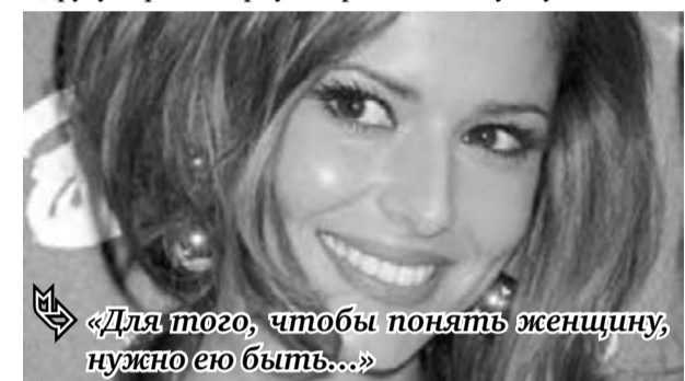
«Для того, чтобы понять женщину, нужно ею быть...»

Самая умная – Василиса Премудрая. Была столь умна, что все мужчины, кроме Ивана-дурака, боялись иметь с ней дело. Не понятая миром, удалилась в дремучие леса, где к старости окончательно превратилась в другую фольклорную героиню – Бабу-ягу.