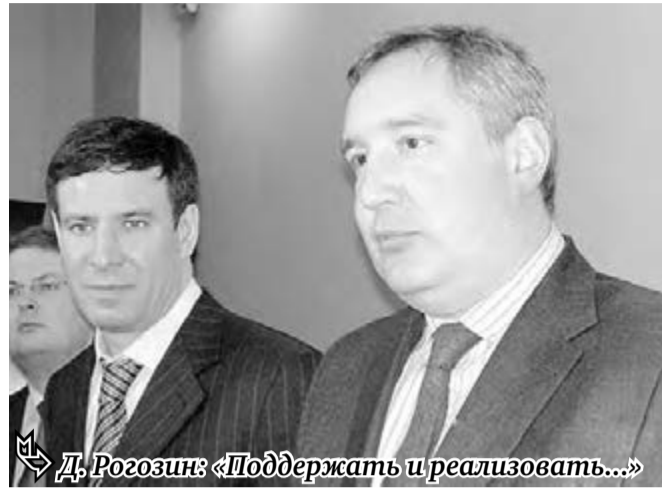
Д. Rogozin «Поддержать и реализовать...»

известии переоснащение лечебных учреждений Южного Урала гамма-камерами. Закономерным развитием ядерной медицины стало бы размещение в Челябинской области производства томографов по технологии международного концерна Philips. Продолжается и создание образовательной площадки, на базе которой будут готовить специалистов в данной отрасли. На базе Озерска можно создать производство оборудования для стерилизации одноразовых изделий медицинского назначения, в том числе одежды, перевязочных материалов», – обрисовал перспективы глава региона.