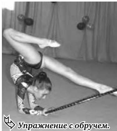
Упражнение с обручем.

физкультурно-оздоровительного комплекса по улице Советской в гибкости, музыкальности, умении владеть предметами сражались юные спортсменки самых разных возрастов – начиная от самых маленьких девочек, выступавших по третьему юношескому разряду, заканчивая мастерами спорта по художественной гимнастике. Мяч сменяли ленты, булавы, обручи, скакалки. Безумно красивые наряды, собранные в пучок волосы, темная подводка на глазах малышей – создавалось впечатление, что здесь собралось более сотни маленьких лебедей, танцующих в известной балетной постановке на музыку Чайковского.