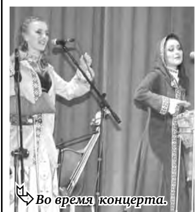
Во время концерта.

Концерт группы «Портреты фа-диез» завершился под горячие аплодисменты зрителей. Впереди у молодых артистов, из года в год улучшающих свое вокальное мастерство в стенах Магнитогорской консерватории, много планов, гастролей и поездок. Пожелаем им и впредь так же талантливо, искрометно, живо привлекать зрительские сердца и к совершенству классики, и к красоте народной музыки.