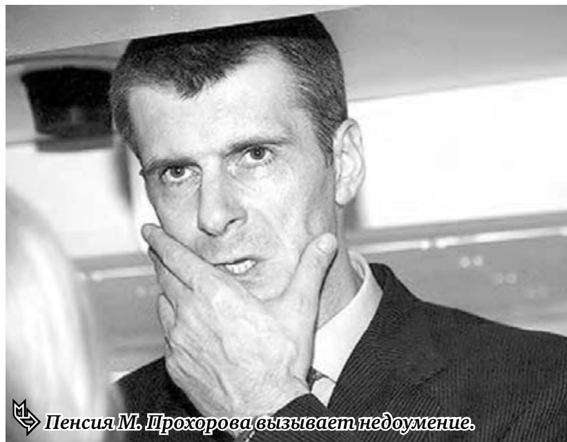
Пенсия М. Прохорова вызывает недоумение.

Особую озабоченность людей вызывает то, что пенсии бывшим руководителям компании должны выплачиваться из НПФ «Норильский никель».