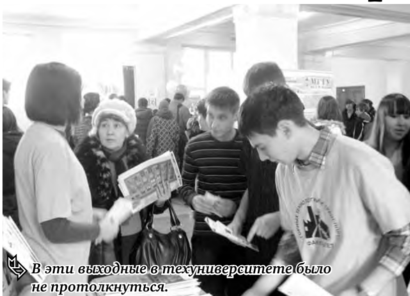
В эти выходные в техникум было не протолкнуться.