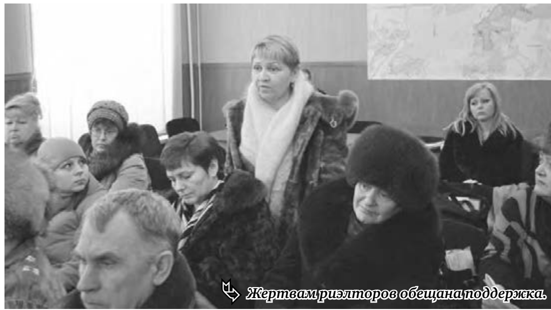
Жертвам риэлторов обещана поддержка.

Сами потерпевшие также надеются, что вмешательство федеральных структур правоохранительных органов приведет к объективному расследованию обстоятельств каждого случая и возвращению жилья его законным владельцам. Как подтвердил уполномоченный по правам человека, на прошлой неделе было возобновлено расследование по семи ранее возбужденным уголовным делам, еще по четырем случаям имеется представление прокуратуры Челябинской области о возбуждении уголовного дела.