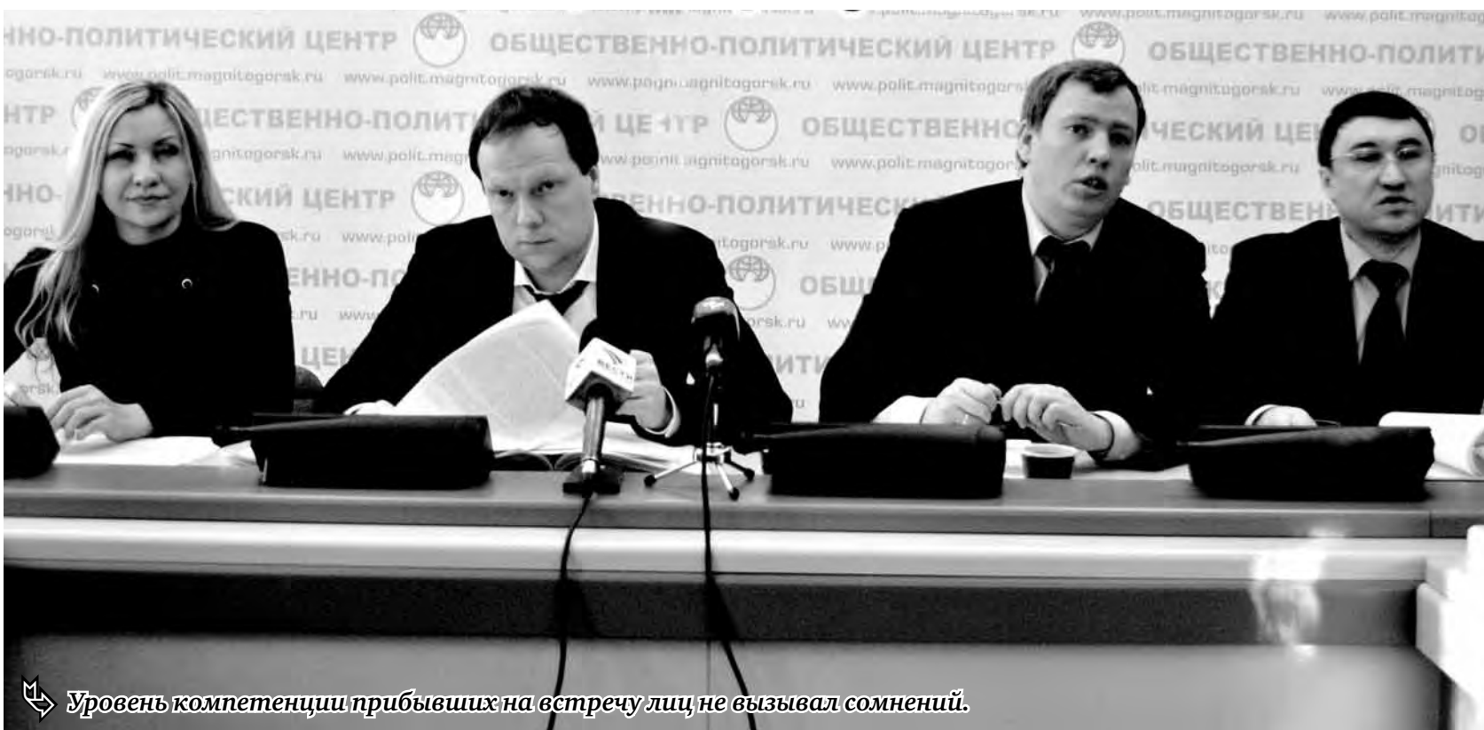
Уровень компетенции прибывших на встречу лиц не вызвал сомнений.