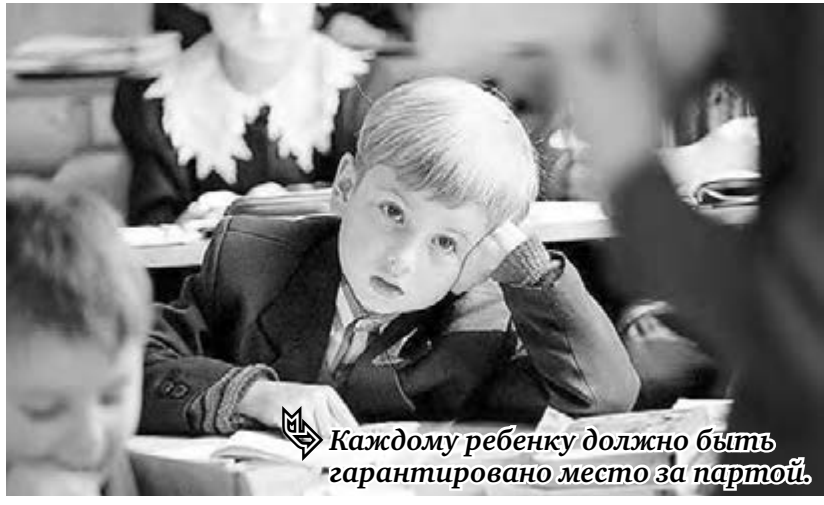
Каждому ребенку должно быть гарантировано место за партой.

жительства. Затем школы зачислят детей из закрепленных домов. И к 1 августа объявят, сколько осталось свободных мест в первых классах.