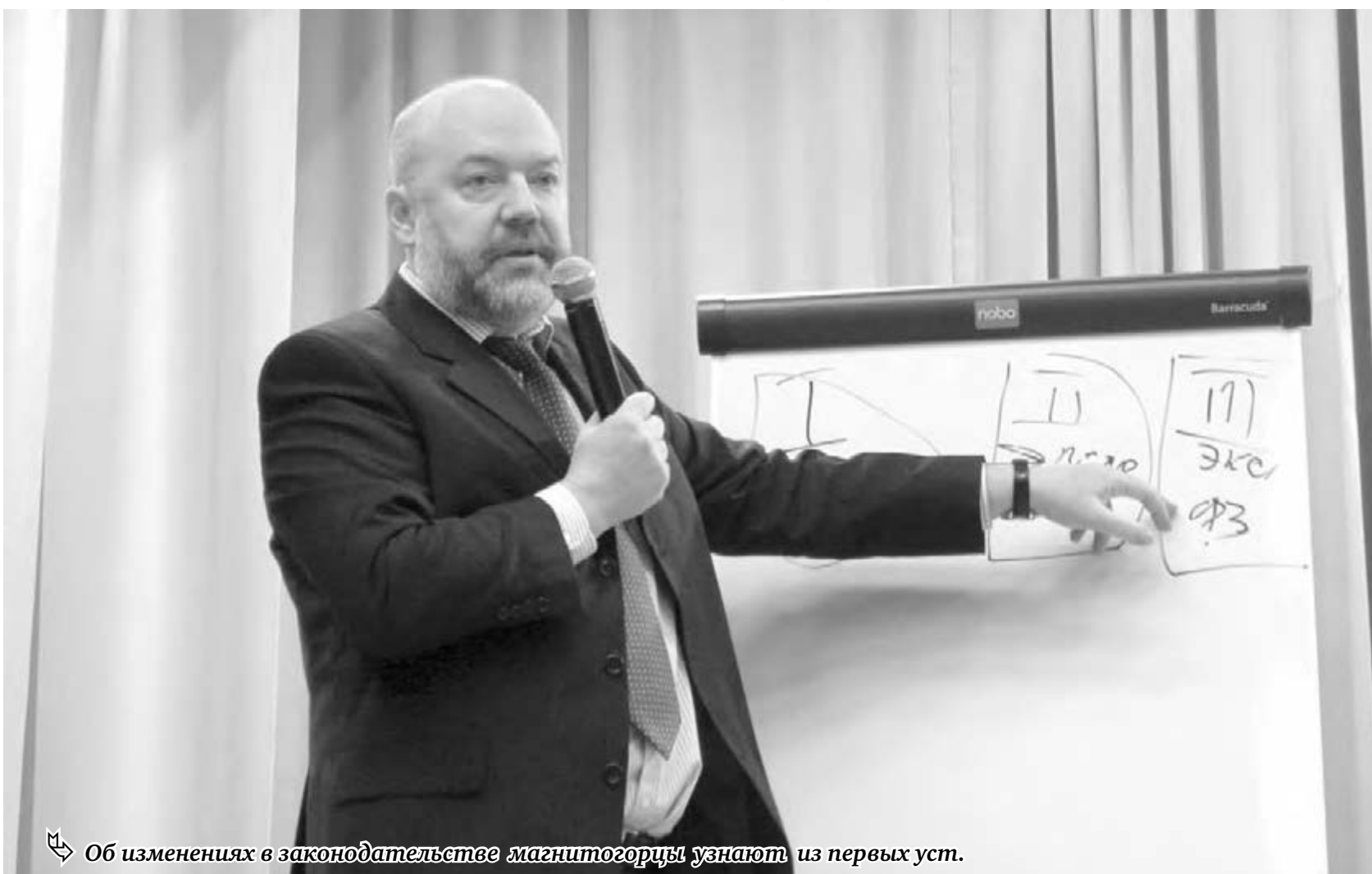
Об изменениях в законодательстве магнитогорцы узнают из первых уст.