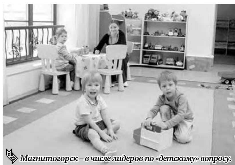
Магнитогорск – в числе лидеров по «детскому» вопросу.