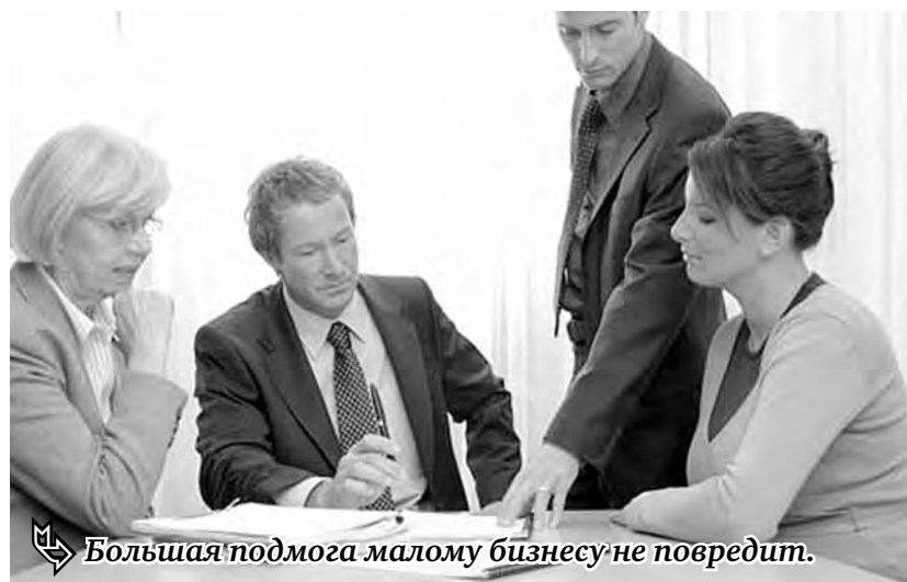
Большая подмога малому бизнесу не повредит.

Начинающим бизнесменам Южного Урала выдали кредитов на миллиард рублей.