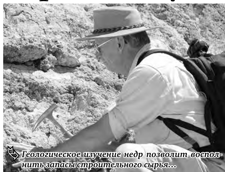
Геологическое изучение недр позволит восполнить запасы строительного сырья...

Он также добавил, что для расширения ми-