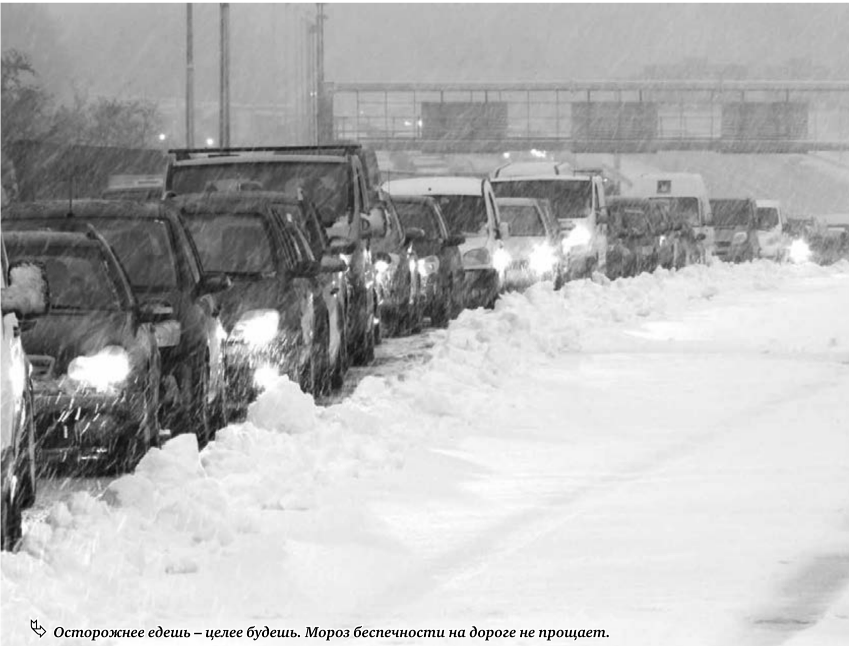
Осторожнее едешь – целее будешь. Мороз беспечности на дороге не прощает.