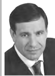
Михаил Юревич, губернатор

Фестиваль «ММЕТ.1А» состоится 25-26 февраля. Организаторы – отдел молодежной политики и общественных проектов администрации города, ДЮСШ № 2, городская секция сноуборда и фристайла, горнолыжный центр. К участию допускаются все желающие, имеющие навыки катания на сноуборде и страховку. Ограничений по возрасту участников фестиваля нет, участникам моложе 16 лет необходимо иметь письменное разрешение родителей. Победители в каждой номинации будут награждены.