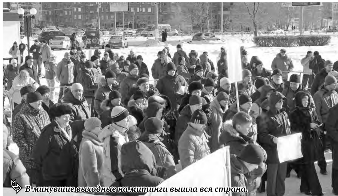
В минувшие выходные на митинги вышла вся страна.

Разумеется, главное вовсе не в количестве собравшихся, а в том, что ныне о чистоте выборов в России заговорили одновременно все: как представители партии власти, так и «пророки» системной и несистемной оппозиции. По крайней мере, при всей неприязненности отдельных высказываний никто не выступил с лозунгом «Да здравствуют помои!» Довольно многие при этом склоняются к выводу о том, что в стране по сути состоялся общероссийский праймериз, по итогам которого с наименьшим процентом погрешности