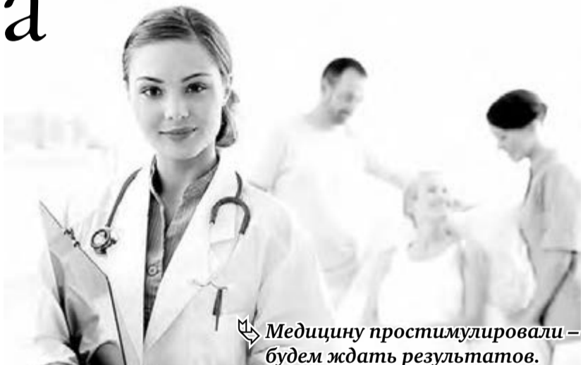
Медицину простимулировали – будем ждать результатов.

В 2012 году нормативы стимулирующих выплат за счет средств субсидий федерального фонда ОМС увеличатся. Врачи-специалисты, оказывающие амбулаторную медицинскую помощь, и врачи параклинических подразделений будут получать стимулирующие надбавки в размере 8000 руб., а с учетом уральского коэффициента и начислений (30,2 процента) эта сумма составит 11978 руб. Выплаты среднему медицинскому персоналу, работающему с вышеуказанными врачами, составят 4000 (с учетом УК – 5989 руб.), фельдшерам, участковым, ведущим самостоя-