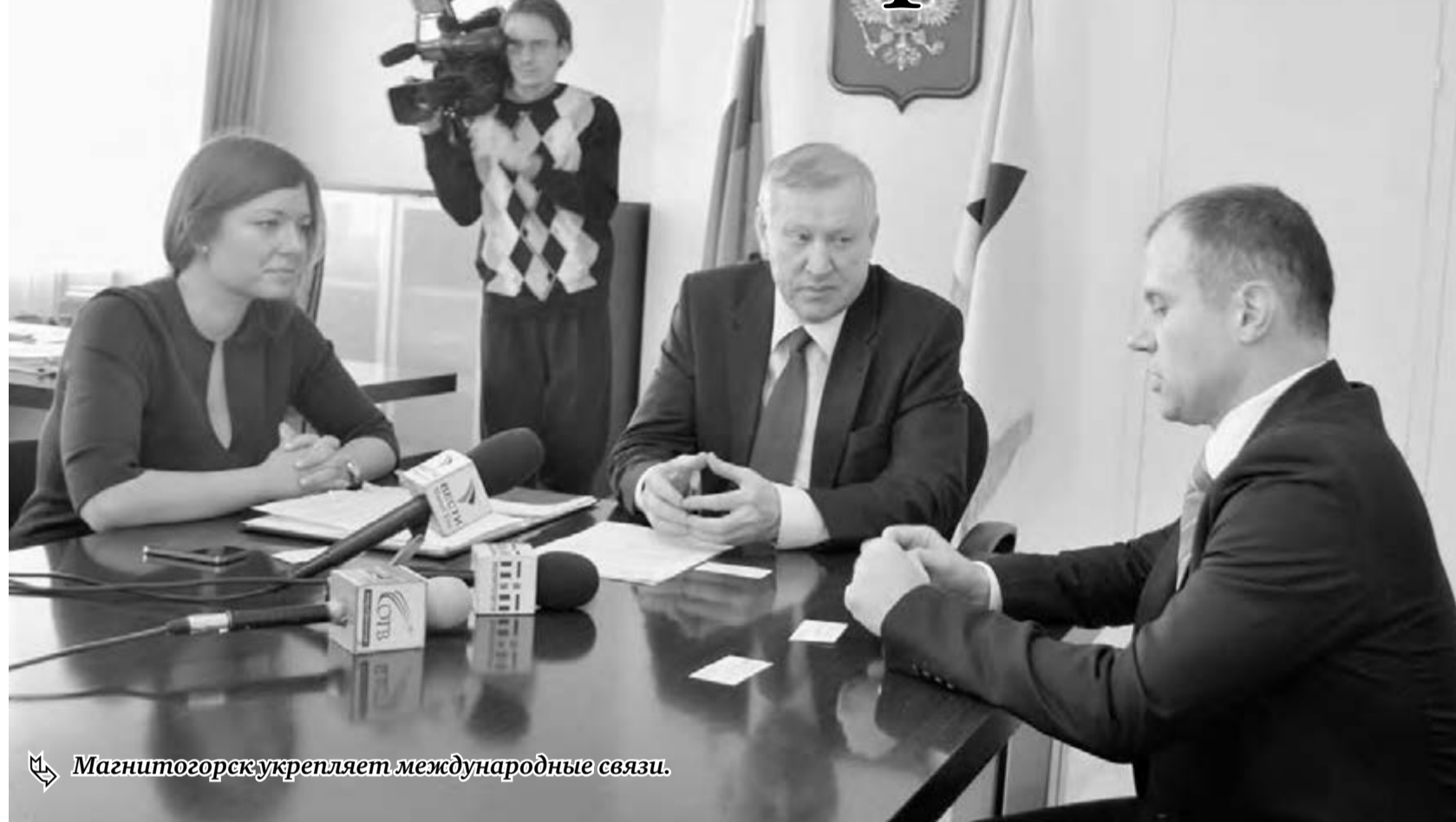
Магнитогорск укрепляет международные связи.