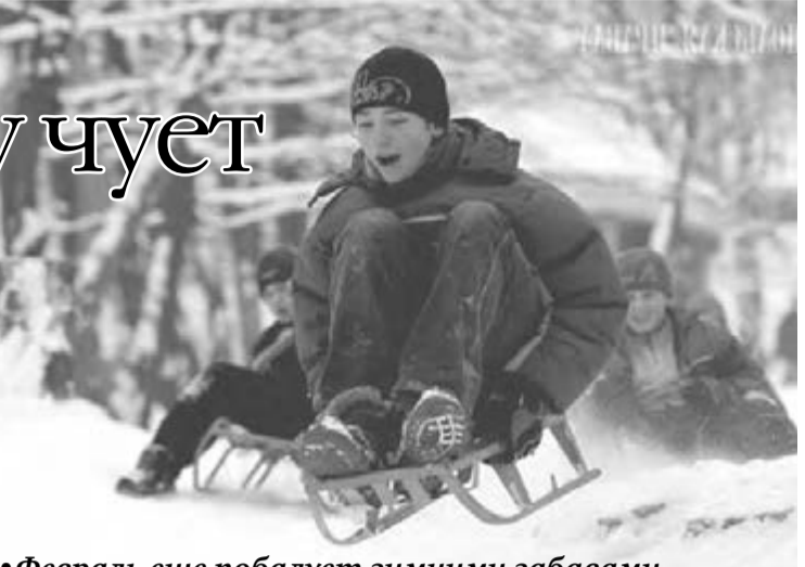
Февраль еще побалуует зимними забавами.