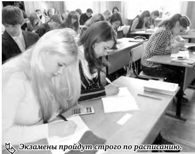
Экзамены пройдут строго по расписанию.

Не позднее 1 марта выпускник должен подать заявление с указанием перечня дисциплин, которые он планирует сдавать. Согласно новым правилам приема в вузы, в этом году, как и прежде, абитуриенты могут подать документы в пять вузов на три направления подготовки или специальности. При этом льготы (те, кто имеет преимущества при поступлении, право зачисления без вступительных экзаменов или вне конкурса) смогут воспользоваться своими привилегиями только в одном вузе и на одной специальности. Они