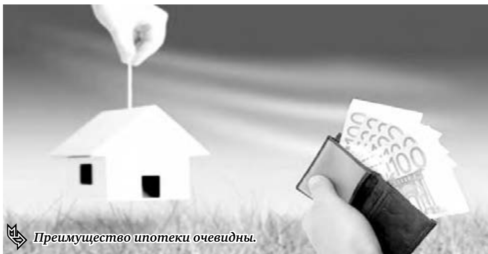
Преимущество ипотеки очевидно.

Все это – весомые аргументы в дискуссии с теми, кто в упор не желает видеть позитивных перемен в стране и области. Конечно, проще всего критиковать власть, не прибегая при этом даже к минимальному набору аргументов. Один из них – статистика – не дает сегодня повода для социального пессимизма. И сыграть на этом в преддверии выборов оппонентам действующей власти становится все сложнее.