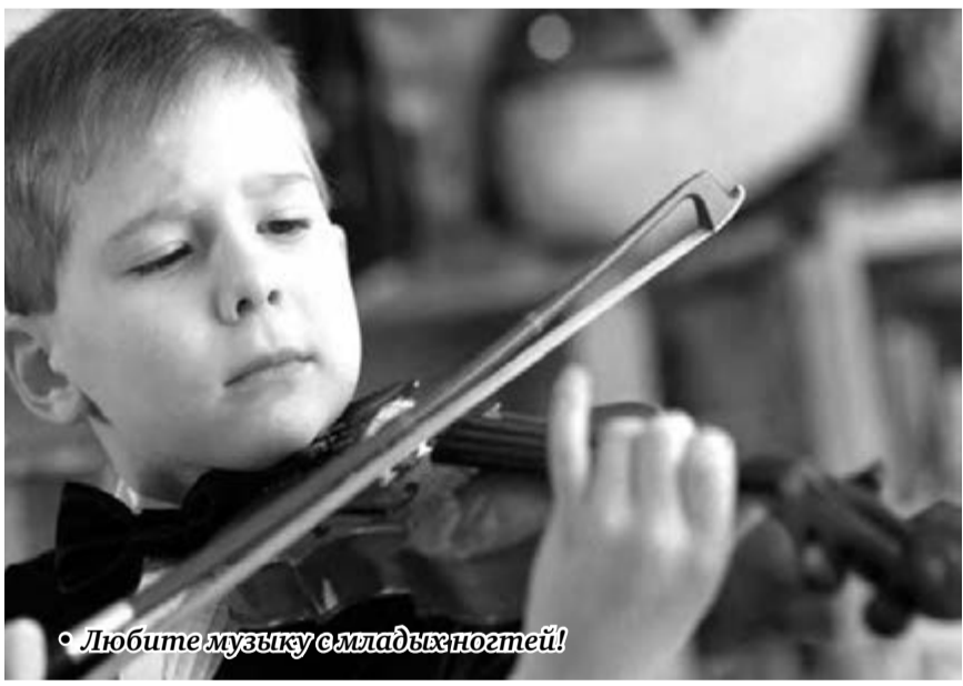
• Любите музыку с младых ногтей!

Прежде чем открывать новую школу выходного дня, у нас внима-