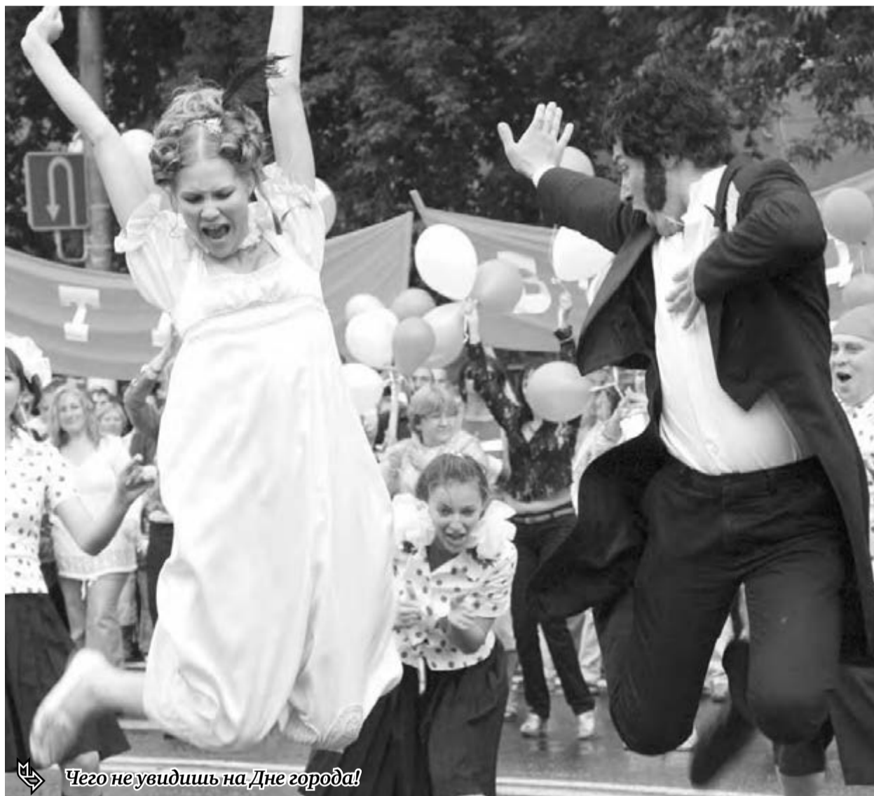
Чего не увидишь на Дне города!

Основные торжества пройдут вечером. На площади перед «Ареной-Металлург» будут работать торговые ряды и сувенирные лавки. Для детей и взрослых приготовлены концертные и развлекательные программы. С девяти часов вечера участники праздника смогут наблюдать за официальной частью действия в Ледовом Дворце, увидят концерт победителей фестиваля «Горящие фонари», выступления других исполнителей. Ожидается участие Полины Гагариной и Дмитрия Колдуна. В самой же «Арене-Металлург» состоится