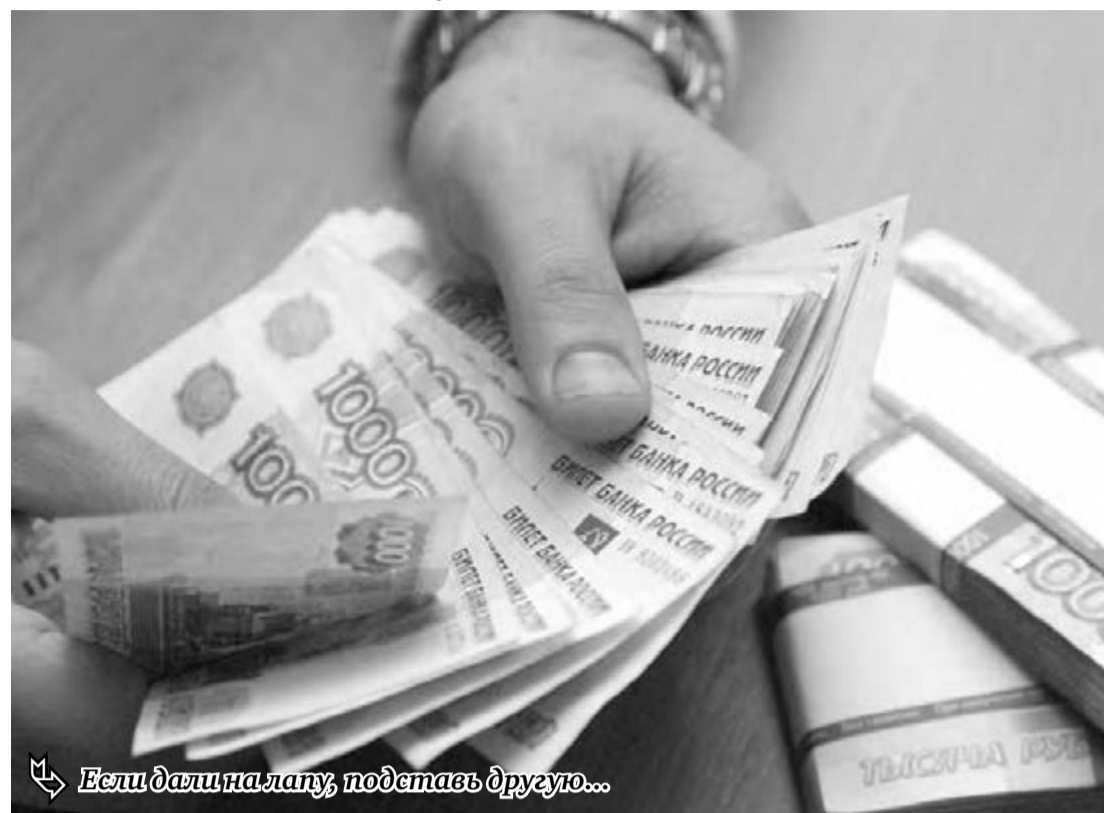
Если дали на лапу, податавь другую...

Эксперты считают, что размер отсидки в денежном эквиваленте должен быть оценен судом в каждом случае индивидуально. Речь идет не о всех взяточниках, а только о тех, кто требовал крупную мзду, да еще и вымогал ее. Проще го-