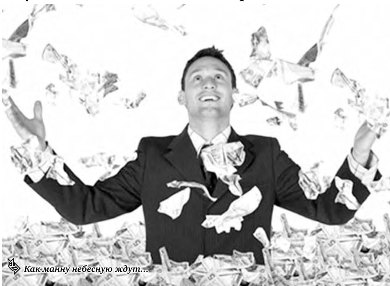
Как манну небесную ждуть...