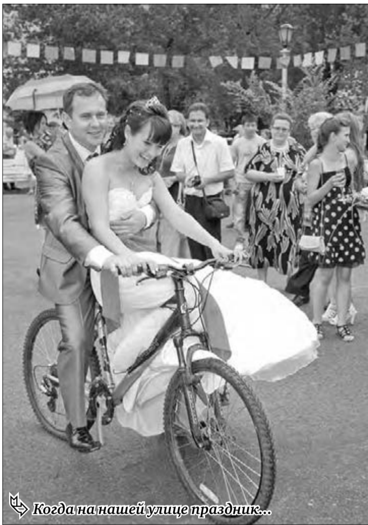
Когда на нашей улице праздник...

В городе состоялись районные праздники улицы Сталеваров и проспекта Металлургов