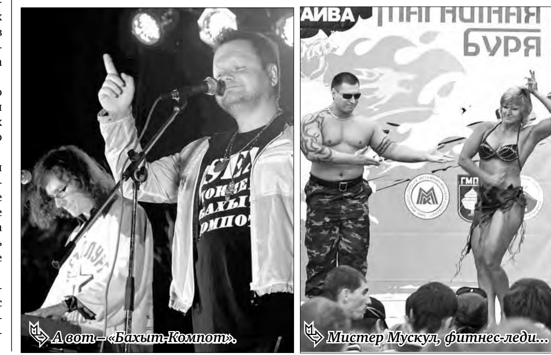
А вот — «Бахыт-Компот».