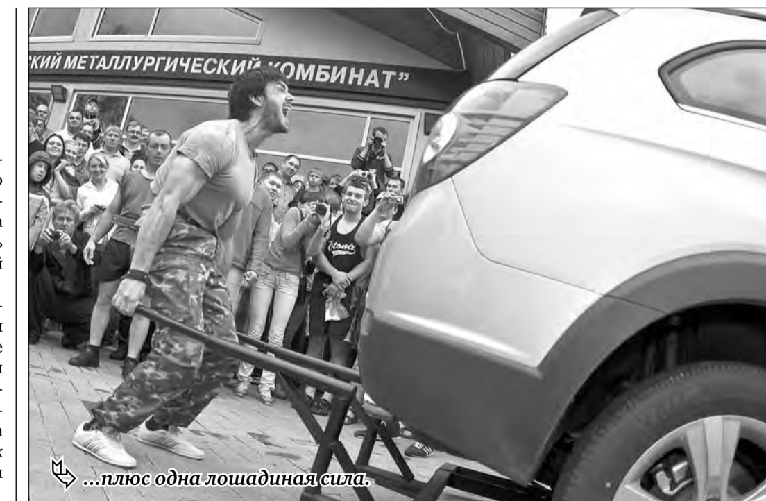
...плюс одна лошадиная сила.

Целый час музыканты радовали публику, выходили на «бис». Остановил концерт лишь стайт в час ночи, после «радушных» залпов самые стойкие тусовщики продолжили дискотеку под открытым небом вместе с объединением «Денс-активность».