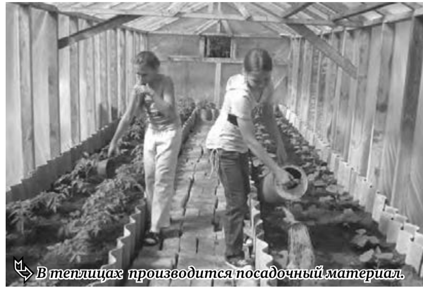
В теплицах производится посадочный материал.

Автор – ученый-селекционер из Саратова Александр Голубев,