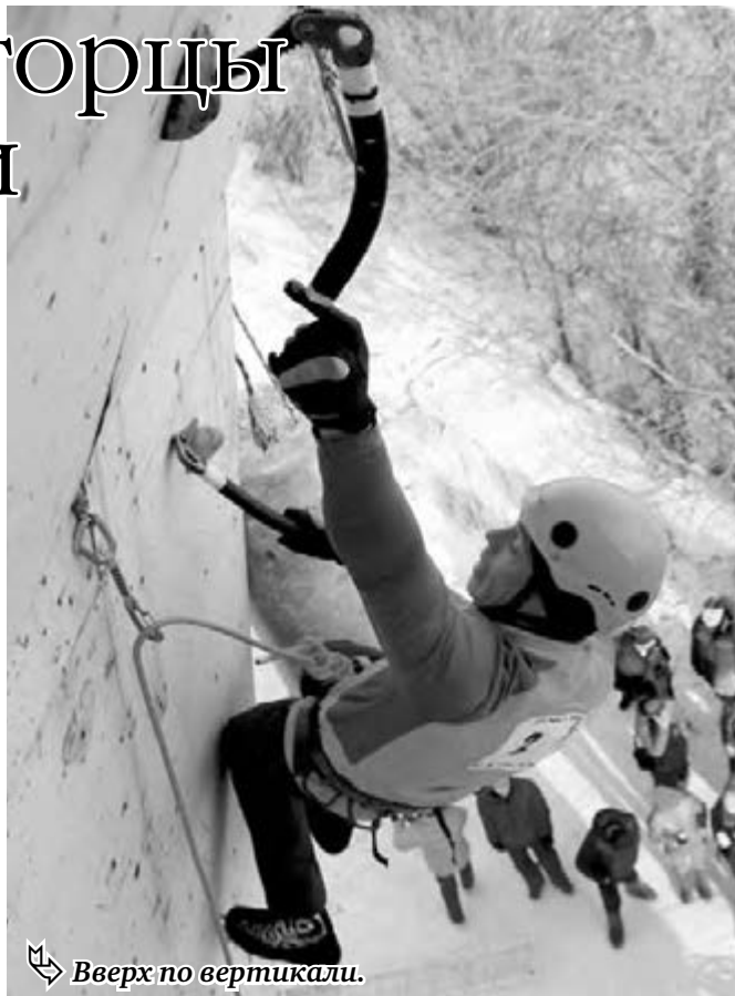
Вверх по вертикали.

Впереди у магнитогорской команды чемпионаты Европы и России, которые пройдут в Кирове.