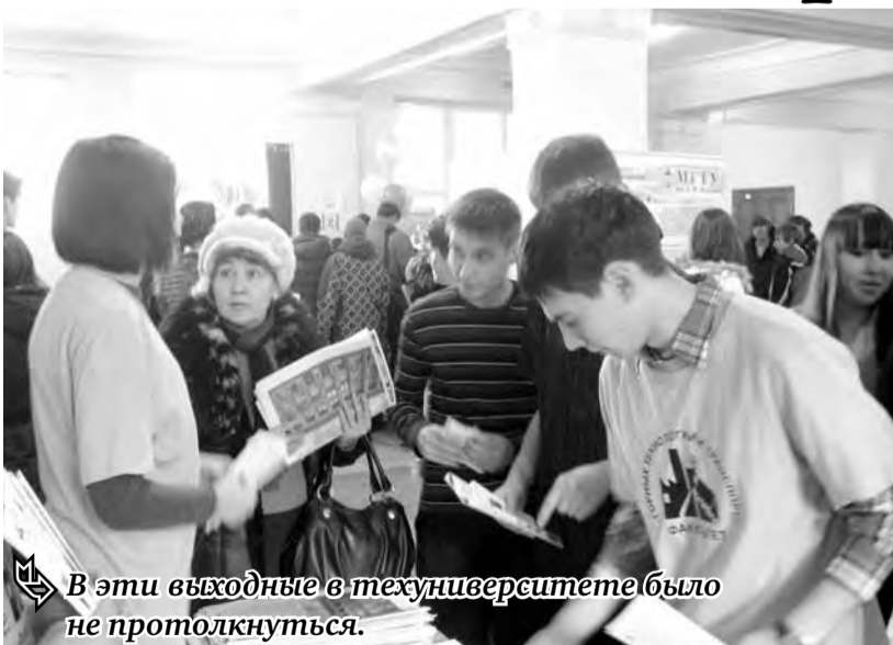
В эти выходные в техникум было не протолкнуться.