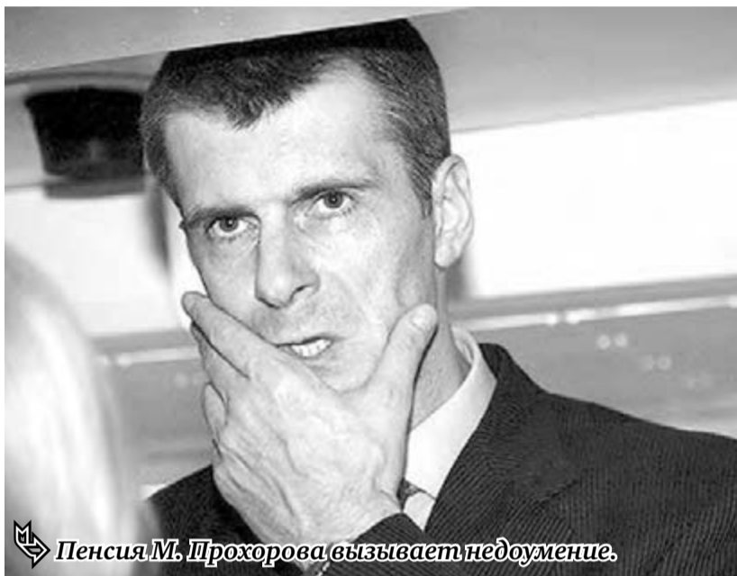
Пенсия М. Прохорова вызывает недоумение.