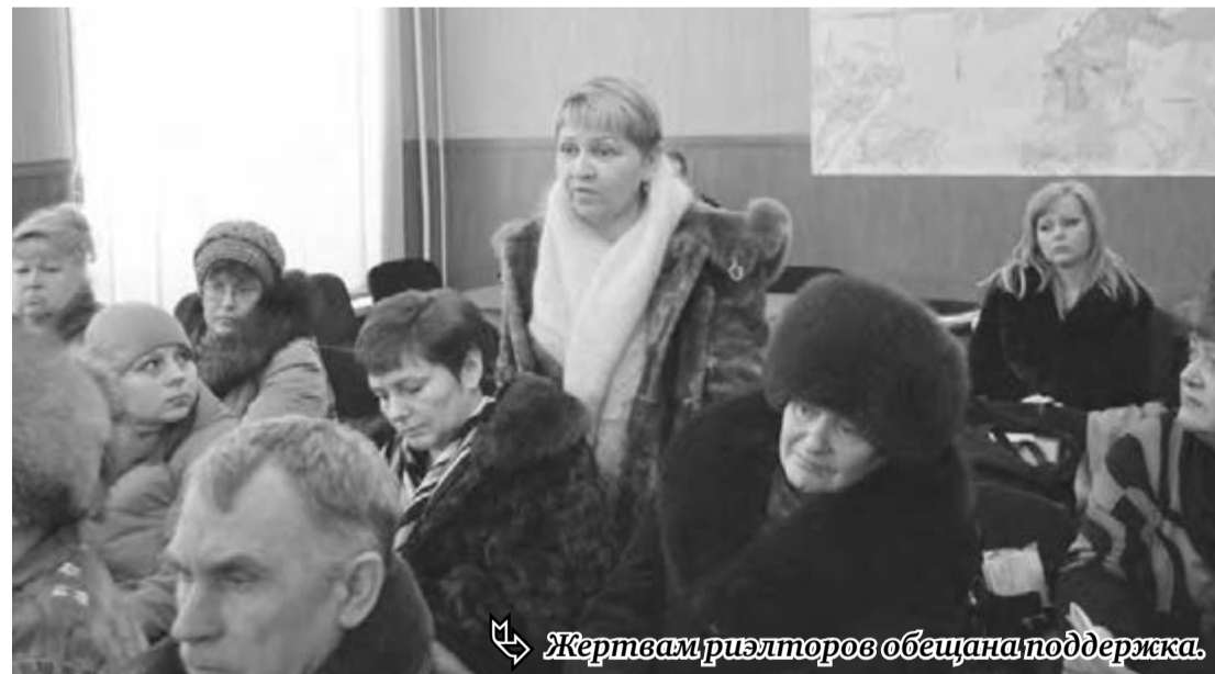
Жертвам риэлторов обещана поддержка.

Сами потерпевшие также надеются, что вмешательство федеральных структур правоохранительных органов приведет к объективному расследованию обстоятельств каждого случая и возвращению жилья его законным владельцам. Как подтвердил уполномоченный по правам человека, на прошлой неделе было возобновлено расследование по семи ранее возбужденным уголовным делам, еще по четырем случаям имеется представление прокуратуры Челябинской области о возбуждении уголовного дела.