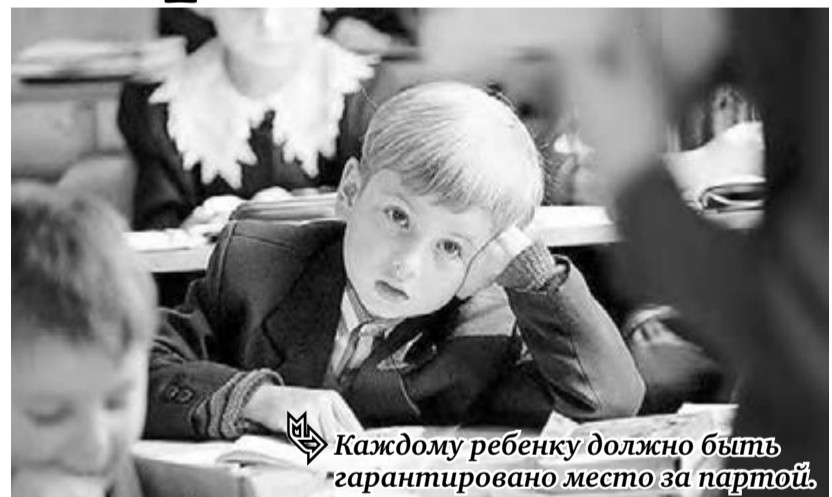
Каждому ребенку должно быть гарантировано место за партой.