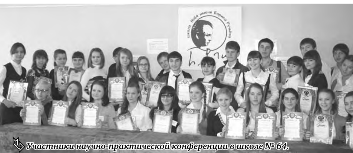
Участники научно-практической конференции в школе № 64.