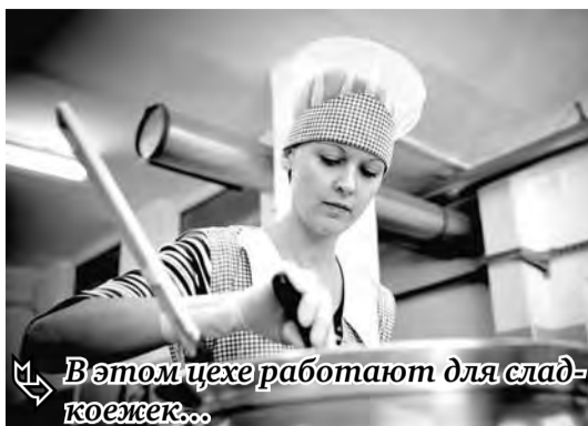
В этом цехе работают для сладкоежек...

В Челябинской области в 2011 году было произведено 140 тыс. тонн кондитерских изделий – на 7,5 процента больше, чем в 2010 году.