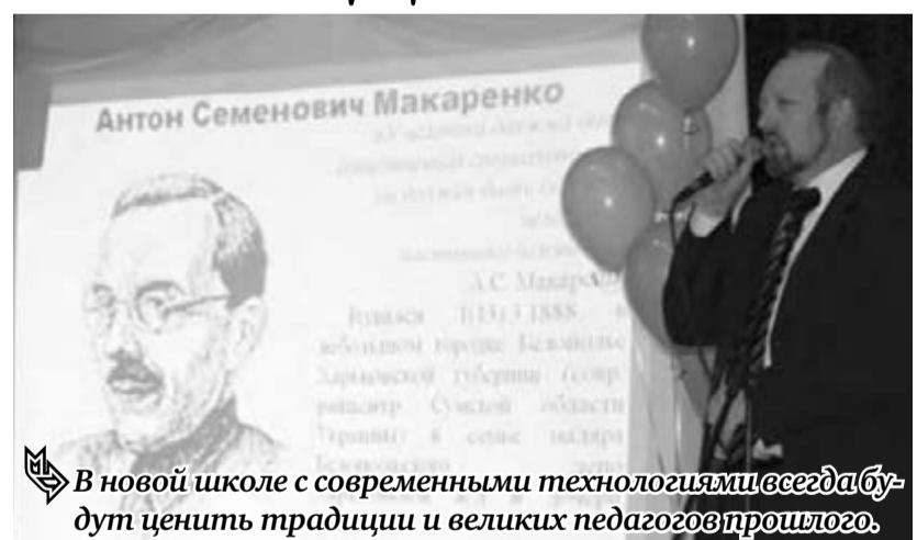
В новой школе с современными технологиями всегда будут ценить традиции и великих педагогов прошлого.

Конкурс организуется в два тура. Отборочный тур проводится заочно на основе представленных документов и материалов, выполненных в форме эссе, докладов, отчетов, разработок, сценариев и т.п. Победители первого тура определяются до 25 марта и приглашаются в финал. Финальный тур проходит очно с 1-го по 5-е апреля в форме мастер-классов участников по трем аспектам деятельности: