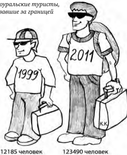
12185 человек 123490 человек

Южноуральские туристы, побывавшие за границей