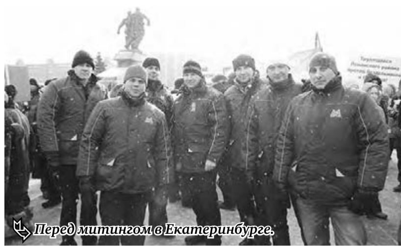
Перед митингом в Екатеринбурге.

– Екатеринбург далеко от Магнитки, но мы все равно решили принять участие в митинге, – говорит работник цеха подготовки аглошты горно-обогатительного