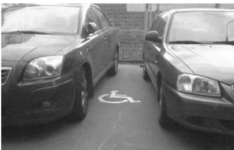
Уступите место автомобилю инвалида.

Летом прошлого года рекомендательная законодательная база была дополнена реальными статьями, предписывающими штрафовать нарушителей. Причем не только тех, кто не выделяет места для транспорта, но и тех, кто на эти выделенные места, не имея оснований, ставит свои машины. Нередко приходилось быть сви-