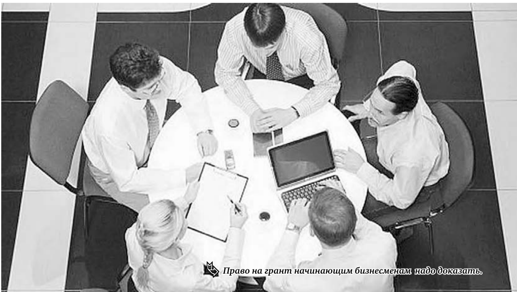
Право на грант начинающим бизнесменам надо доказать.