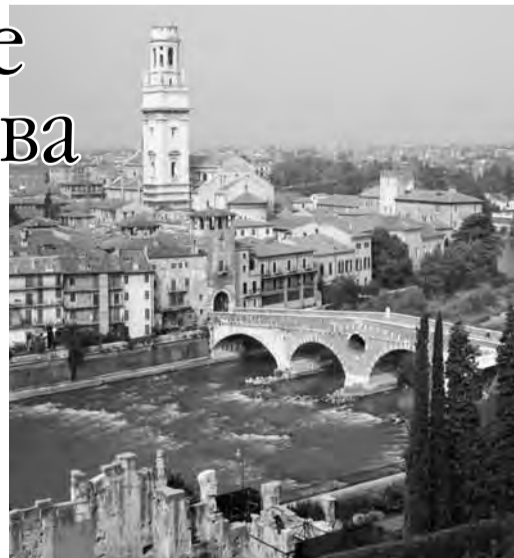
● Климат Италии полезен для экономик.

А с 25 по 27 января официальная деловая делегация Челябинской области посетит