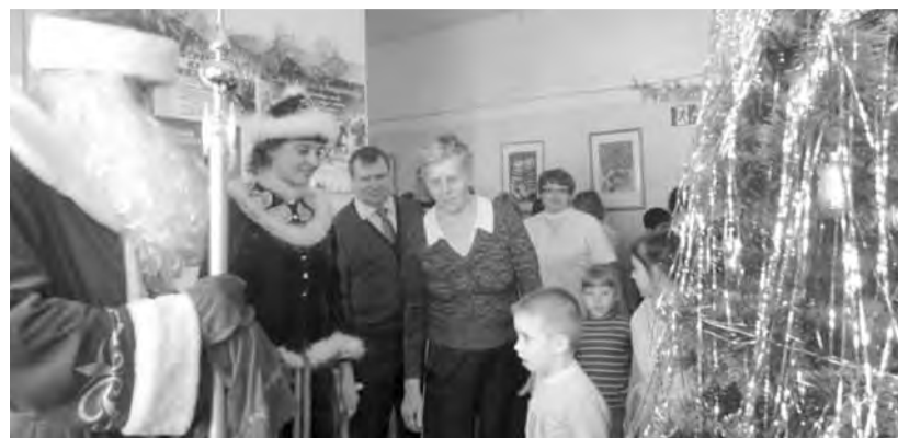
● Елка в детской больнице.