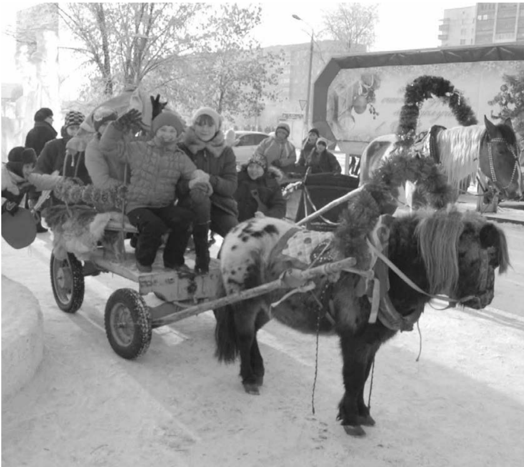
● От желающих прокатиться отбоя нет...