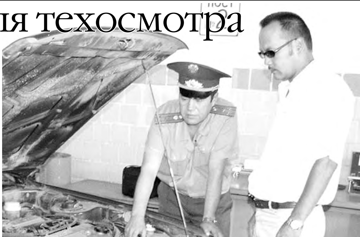
● Техосмотр – для вашей безопасности.

Вторым доказательством сохранения процедуры техосмотра будет тот факт, что водители, которым в этом году потребуются выехать на автомобиле за границу, должны получить дубликаты талонов о прохождении ТО. В них должен быть указан срок предоставления транспортных