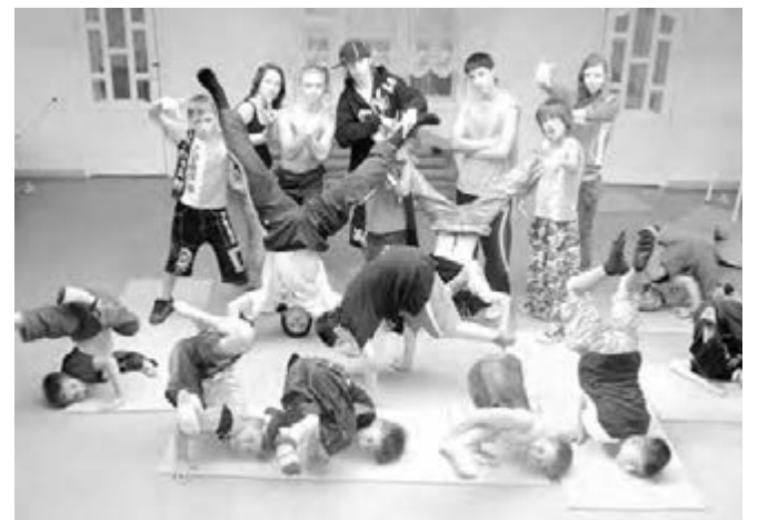
● Вот так примерно надо танцевать.

Организаторы в лице специалистов службы внешних связей и молодежной политики администрации города и промо-группы «Dance Активность» обещают настоящий драйв для ценителей направлений хип-хопа, хауса и фанка. Судить участников будут профессиональные танцоры из Хельсинки и Москвы.