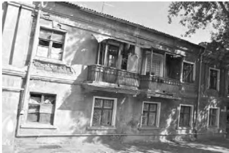
● Дом ветхий, хоть и каменный.

Безусловно, жаль активных, честных плательщиков, ставших заложниками пьющих и дебоширящих соседей, временного отсутствия средств на расселение дома, но опускать руки не стоит. Ситуация с ветхо-аварийным жильем на постоянном контроле у главы города Евгения Тефтелева. Вариантов решения вопроса с расселением ветхого жилья не так уж мало: изыскание средств в муниципальном фонде, коль скоро дом не попал под федеральную программу, средства инвесторов, застройщиков, претендующих на данные площади. Вопрос решаем, но для этого потребуется время.