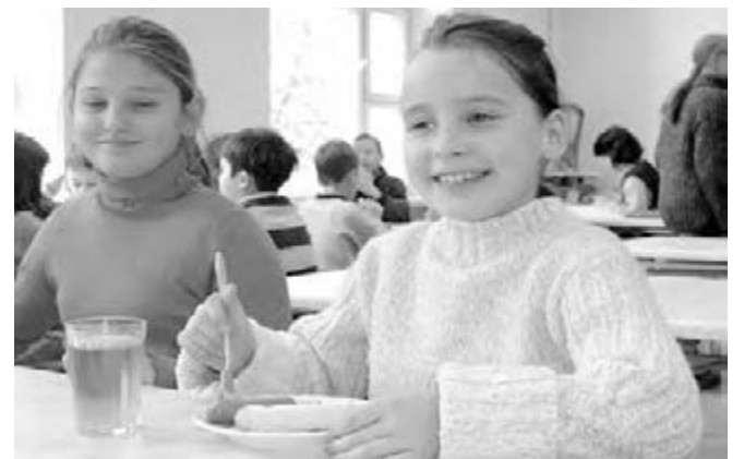
● Главное для здоровья детей – правильный режим питания.

Совершенствование системы питания в общеобразовательных учреждениях напрямую связано с сохранением здоровья населения и задачами улучшения демографической ситуации в Челябинской области.