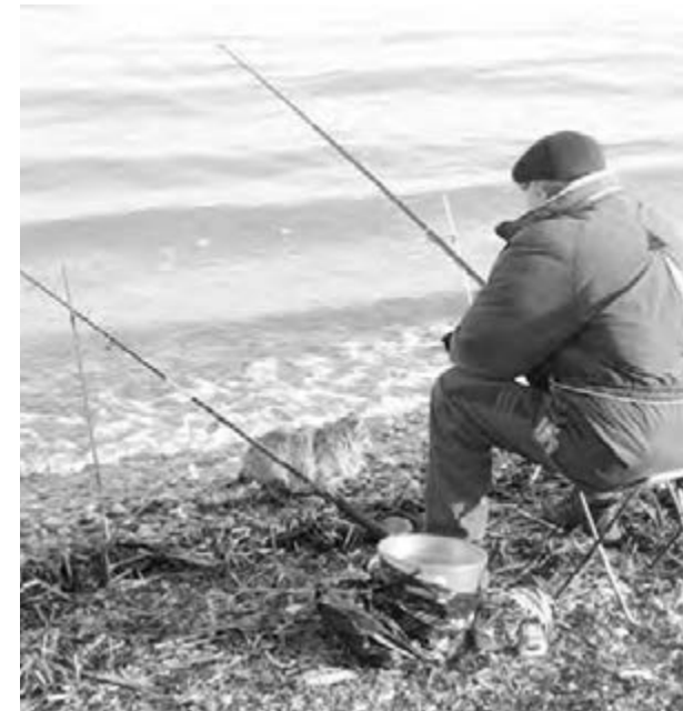
● Не попасть бы на крючок к приставам.