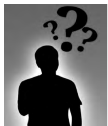
Ответы на задание «МР» от 3 июня: