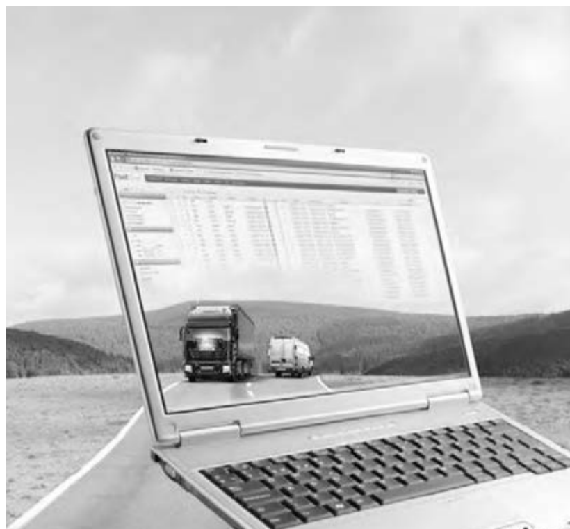
● На Южном Урале разрабатывается областная целевая программа развития технопарков.

Сегодня на Южном Урале уже существуют уникальные инновационные разработки. Например, производство кристаллов для светодиодов в Снежинске, аппарат искусственной печени профессора Рябинина в Миассе, дифференциал Красикова в Новосинелазово, малоразмерные дизели ЧТЗ в Челябинске, солнечный кремний в Кыштыме. Кроме того, уже созданы элементы инфраструктуры инновационной системы, приступил к работе венчурный фонд Челябинской области – с активами в 480 милли-