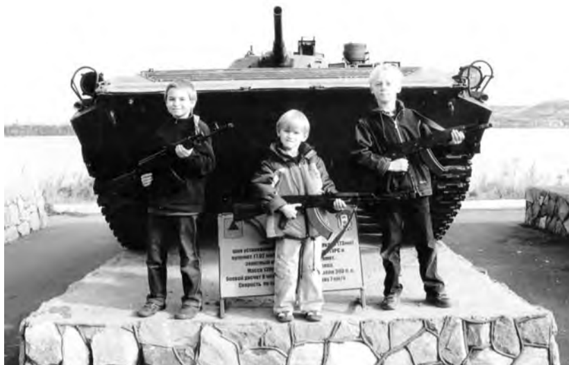
● У одного из экспонатов «музея под открытым небом».

В 70-е годы, согласно решению Центрального комитета ДОСААФ в Магнитогорске было предусмотрено строительство учебно-спортивного комплекса. В 1978 году была перерезана лента, и