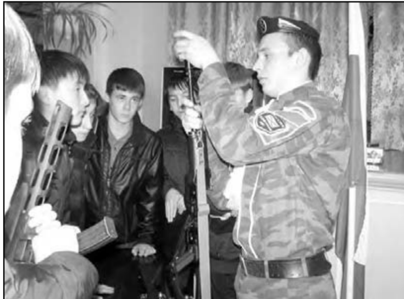
● Мальчишек тянет к оружию.