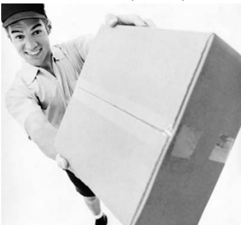
● Бойтесь данайцев, дары приносящих...

У продавца должен быть документ (кто он, от имени какой организации продает). До передачи денег продавцу внимательно изучите паспорт изделия, в т.ч. сведения о противопоказаниях, потребуйте сертификат. Информация об изделиях медицинского назначения должна содержать сведения о номере и дате разрешения на применение таких изделий в медицинских целях (регистрационное удостоверение). Вместе с товаром вам должны дать товарный чек. Если у вас есть сомнения – не мошенник ли перед вами? – смело обращайтесь в правоохранительные органы.