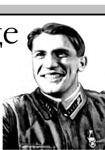
тора Дмитрия Покрасса. А 4–5 июня 1953 года в Магнитогорском госцирке он принял участие в вечерах мастеров советского кино вместе с Сергеем Гурзо, Ольгой Жизневой, Лидией Смирновой и другими.

Следует отметить, что знаменитый артист дважды побывал в Магнитогорске. 17–18 июля 1948 года в нашем городе состоялся гастроль Николая Крючкова с участием композитора Дмитрия Покрасса. А 4–5 июня 1953 года в Магнитогорском госцирке он принял участие в вечерах мастеров советского кино вместе с Сергеем Гурзо, Ольгой Жизневой, Лидией Смирновой и другими.