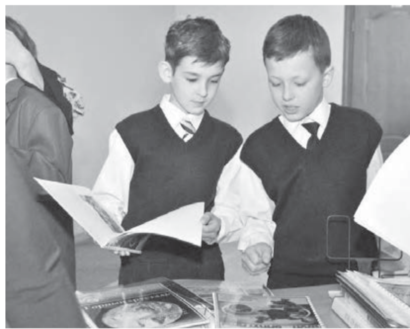
● В науку с младых ногтей.

Всем желающим была предложена возможность раскрыть именно те вопросы, которые в первую очередь интересны самим