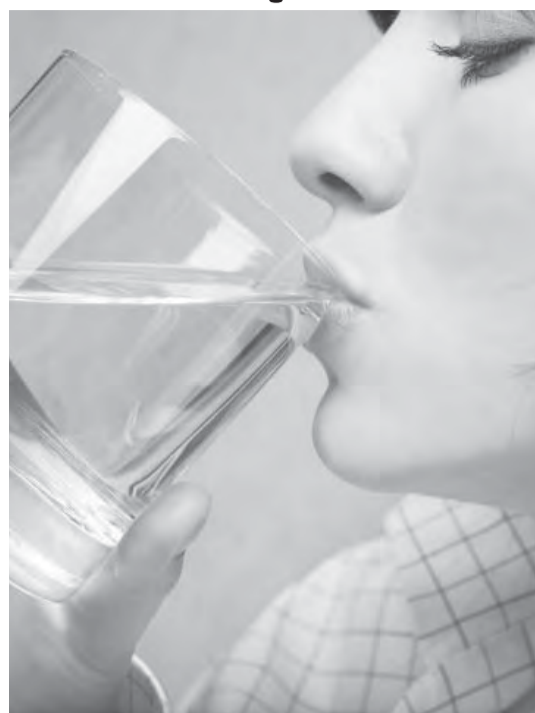
● За водичку вычтут из зарплаты...

Однако эксперты отмечают: для того, чтобы подсчитать точное количество выпитых стаканчиков воды, надо будет поставить сторожа,