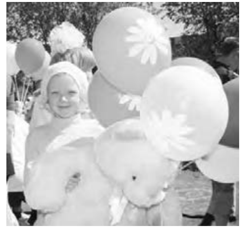
● Детвора довольна.

Особая благодарность всем покупателям магазинов «СИТНО» за участие в благотворительной акции!