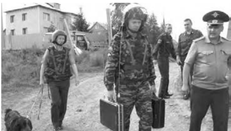
● Момент учений.

Национальный антитеррористический комитет и ФСБ России совместно с другими правоохранительными органами провели в Магнитогорске учения по предупреждению и пресечению преступлений террористического характера.