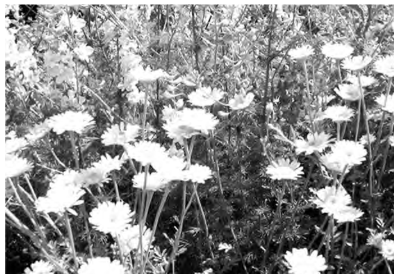
● Как красивы они, полевые цветы...

Главное, в чем нуждается растительность в июне - тепло и влага. В метеорологическом отношении июнь служит показателем погоды на декабрь. С летнего солнцестояния, солнцеворота, день будет убывать, а тепло прибывать. Июнь называют временем длинных трав и сенокосов. С Иванова дня (7 июня) идут медвяные росы, которые одни считали вредными, другие признавали за ними целебную силу. Основные посевы заканчивали к 13 июня, Еремею Распрягальнику. Большое значение в предсказании будущей погоды в народе придавалось дню Лукиана