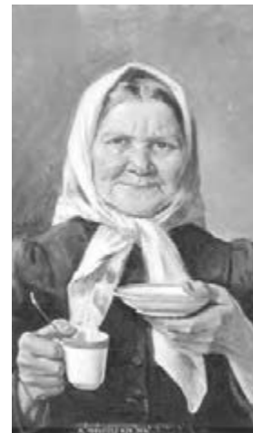
● «Начните утро с чашечки кофе!»

ровании, проведенном учеными из Аризоны. В связи с этим геронтологи рекомендуют пожилым людям назначать важные встречи на утро и выпивать чашку кофе, которая способна сохранить их голову светлой и во второй половине дня. Однако важно учесть, что из-за высо-