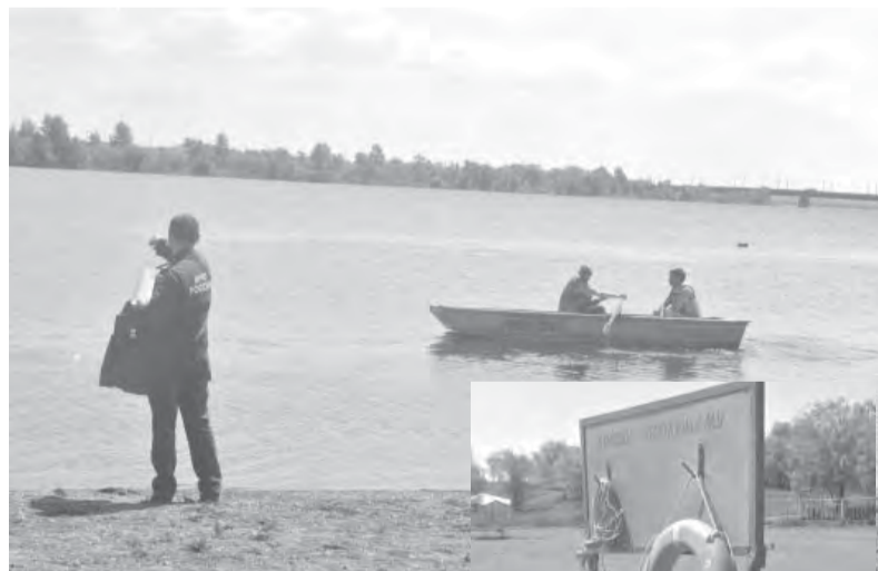
● Все три городских пляжа к лету готовы.