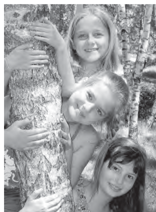
● Каникулы – это здорово!

На особом контроле в управлении образования малообеспеченные и многодетные семьи, дети и подростки, состоящие на учете в подразделениях по делам несовершеннолетних. Таким ребятишкам путевки в городские и туристические лагеря выдаются без родительской платы. Кроме того, будут организованы профильные трудовые отряды, в которых подростки смогут не только отдохнуть, но и заработать на благоустройстве городских скверов. Подростки вправе