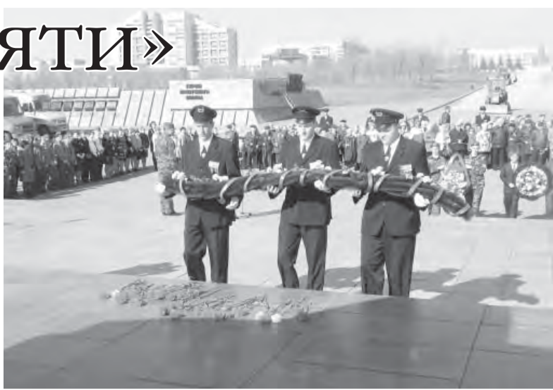
● На «Маршруте памяти».

«Маршрут памяти», возвращая нас к Великой Победе, превращается в акцию единения патристически настроенной молодежи.