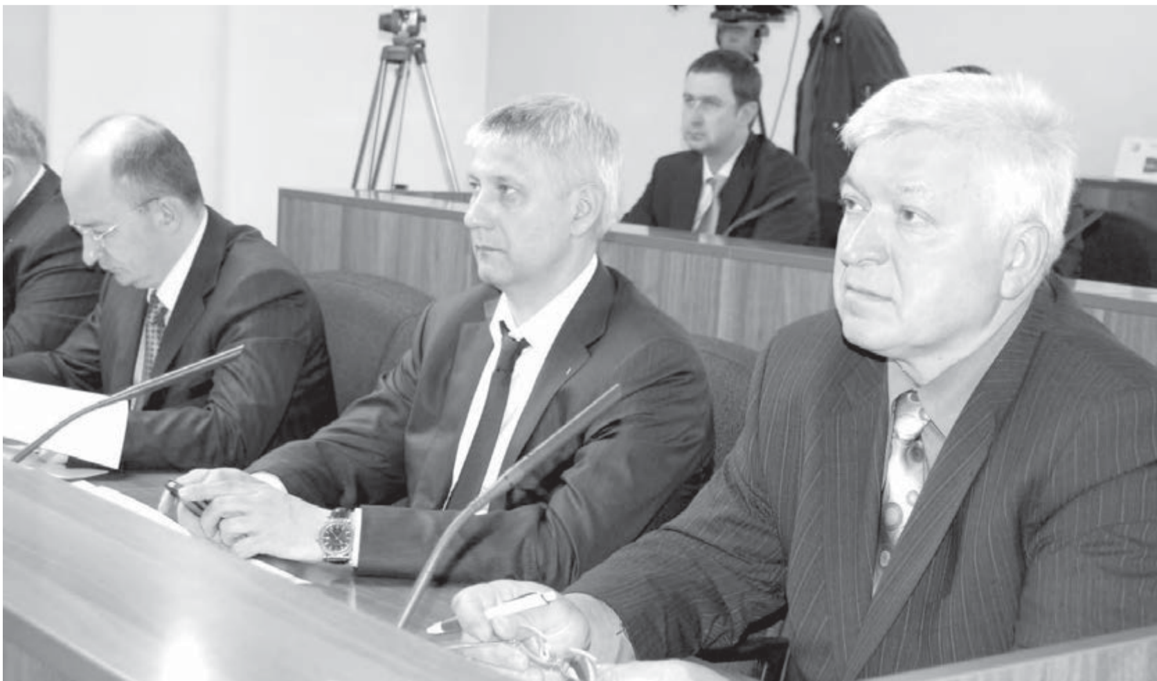
● В зале заседаний МГСД.