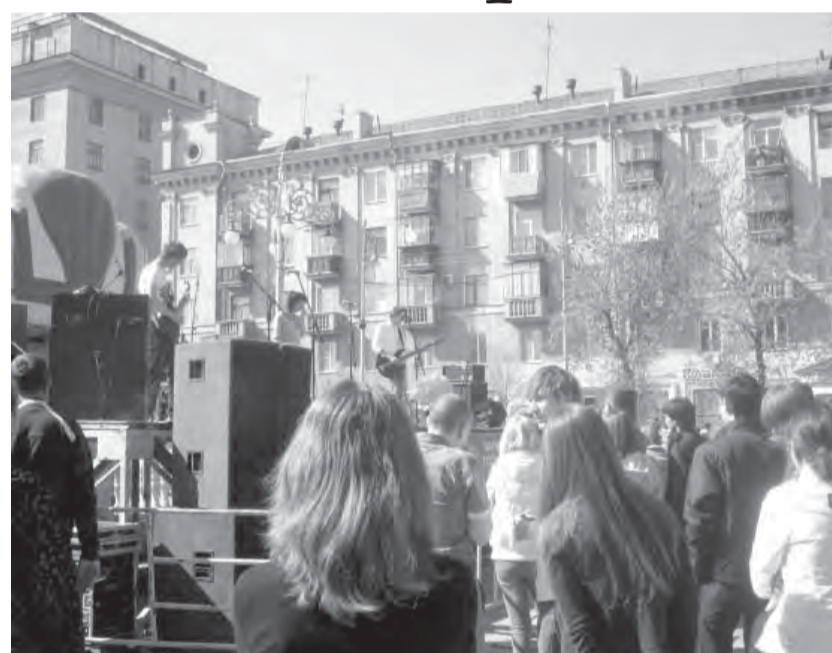
● На фестивале свободного искусства «Ъ».