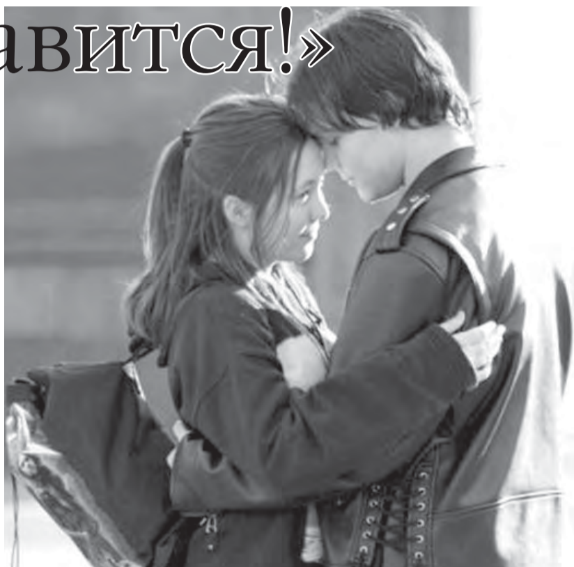
● Первая любовь. Кто даст совет?

«Помогите, пожалуйста, разобраться... Я очень люблю свою старшую дочь. Ей 16 лет. Учится