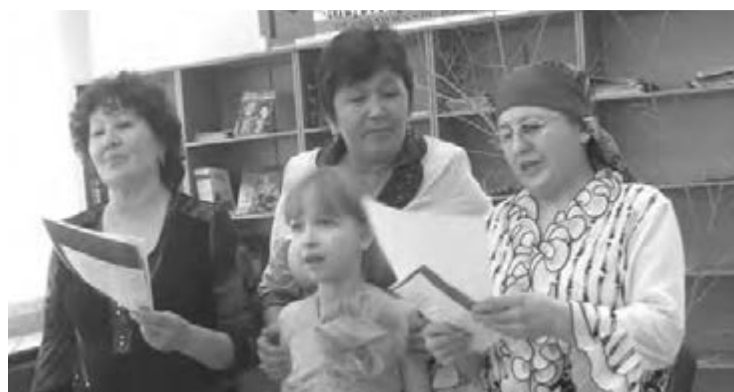
•Лирика Тукая волнует читателей и ныне.

В юности он работал наборщиком, сотрудничал с газетами и журналами, где печатал свои поэтические произведения, статьи, фельетоны. В 1907 году переехал в Казань, где сблизился с писателями-демократами. В основу его творчества были положены революционные идеи, борьба народных масс за свою свободу. Тукай считается зачинателем революционно-гражданской лирики в татарской литературе, а также основоположником