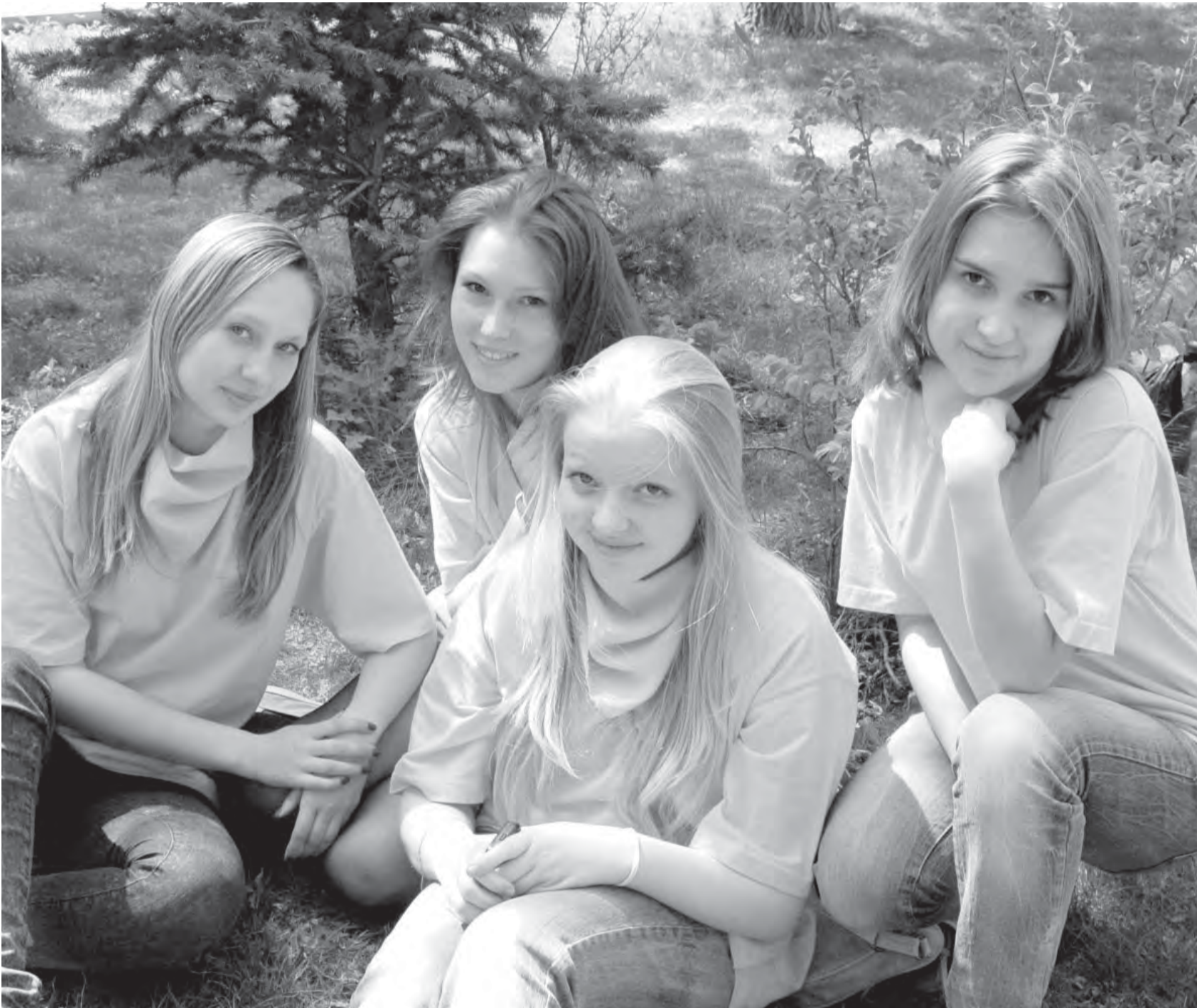
● Магнитогорские школы делегировали на слет «Весна надежд» команды парламентариев.