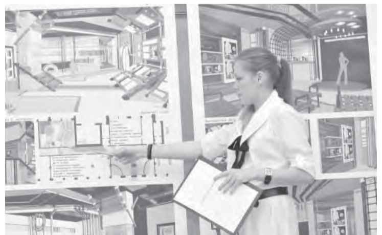
• Это защита дипломов – праздник дизайна.

Лично меня невероятно обрадовала концепция зимней