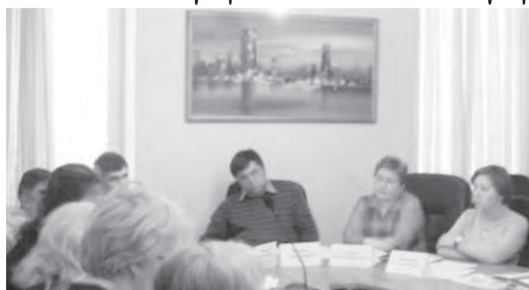
● На «круглом столе» думали, как наладить бизнес.

Магнитогорская торгово-промышленная палата создает клуб начинающих предпринимателей.