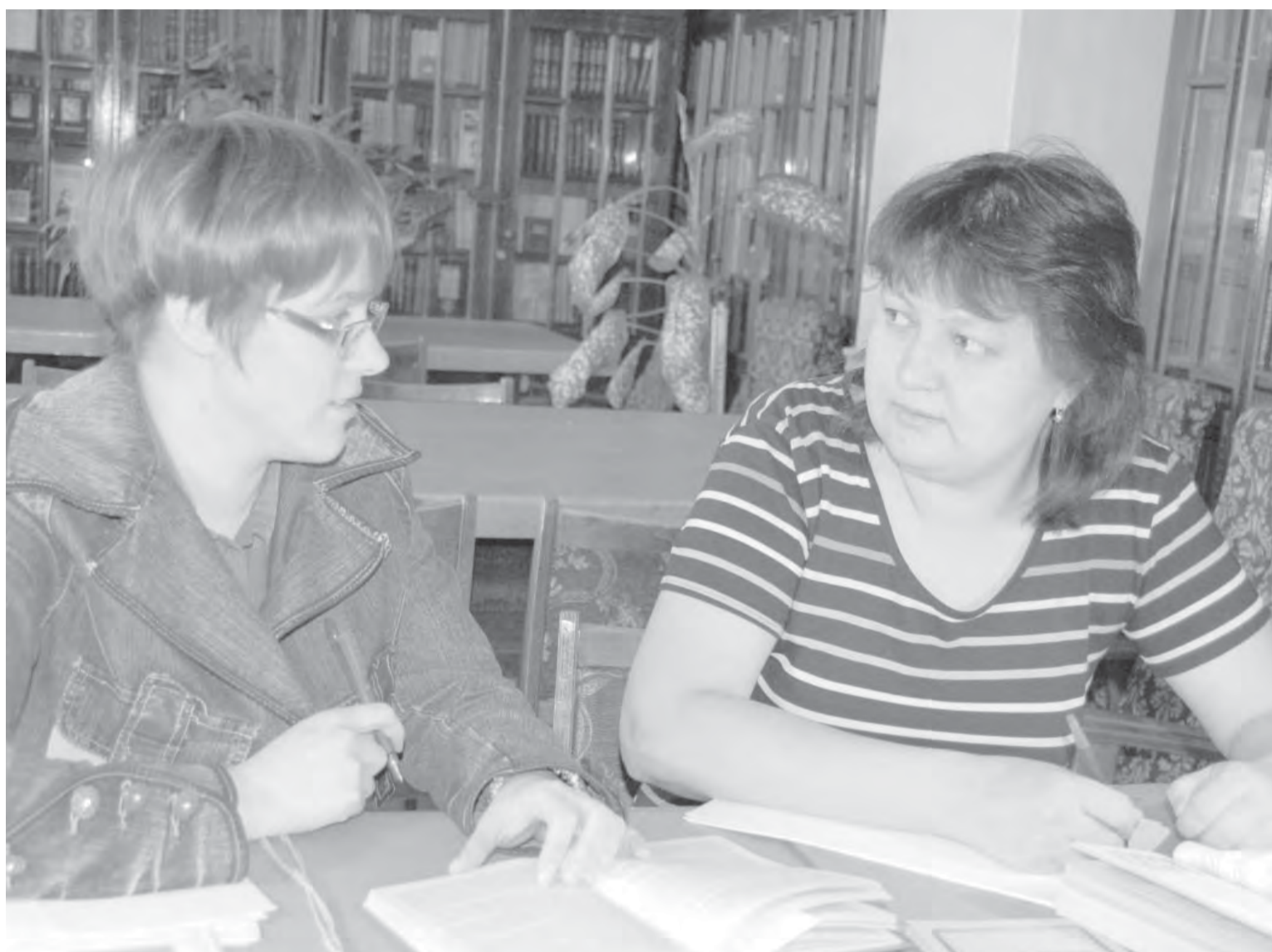
● В читальном зале Центральной библиотеки строителей.