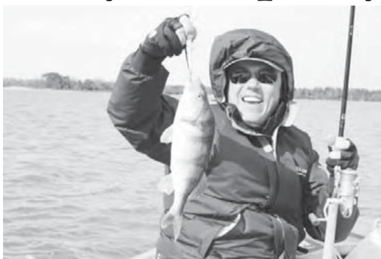
● За незаконное взимание платы с рыбаков предприниматели могут лишиться водоёмов...

– До 11 января 2011 года любительское рыболовство на подобных участках могло осу-