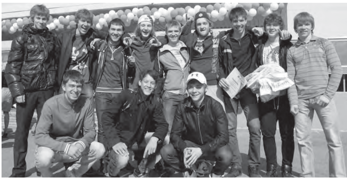
Выпускников приветствуют юные черлидерши

Можно долго перечислять успехи нашей хоккейной шко-