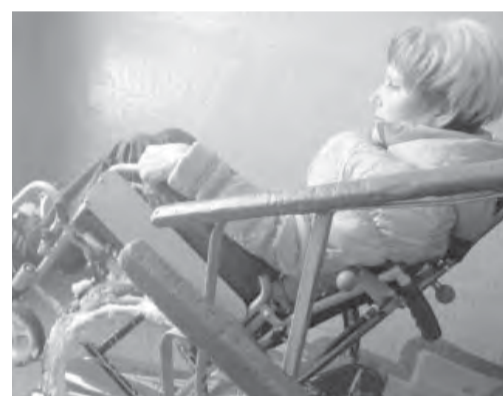
● Помоги инвалиду чем можешь.

Итоги конкурса подведут в канун Дня города, а победители будут отмечены специальным знаком «Доступное учреждение». В молодежной палате утверждают, что главное для них – составить реальную картину того,