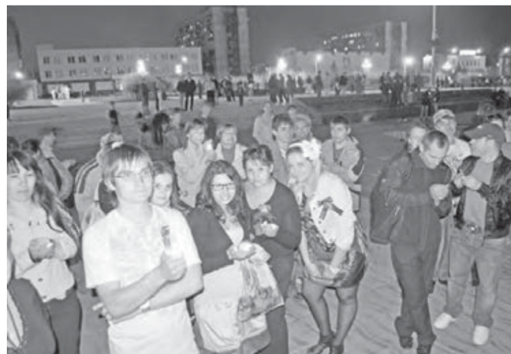
• В руках ребят – свечи Памяти.

9 мая за 10 минут до назначенного времени в окнах домов начали гасить свет и зажигать свечи Памяти. На площади На-