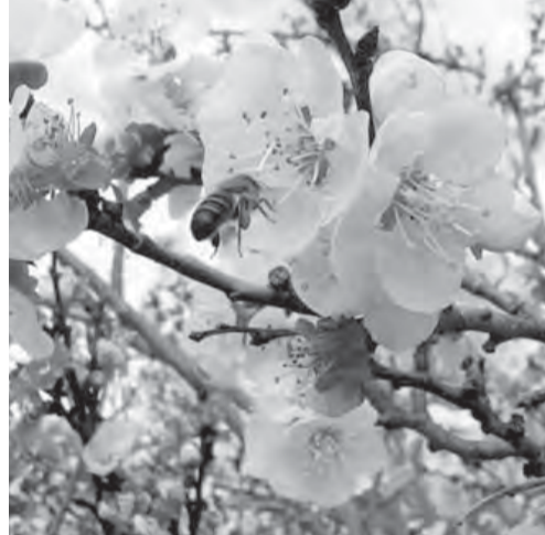
Нынешняя зима стала настоящим испытанием для южноуральских абрикосов.

Культура эта нынче в моде. Многие решили завести южанку у себя на участке. Между тем, по наблюдениям опытных агрономов, последние две зимы были просто трагичными для большинства сортов абрикосов. Причина – в резких колебаниях температур. Такое явление наблюдалось, например, зимой 2008-2009 годов. Весной 2010 года холодная ветреная погода препятствовала лету