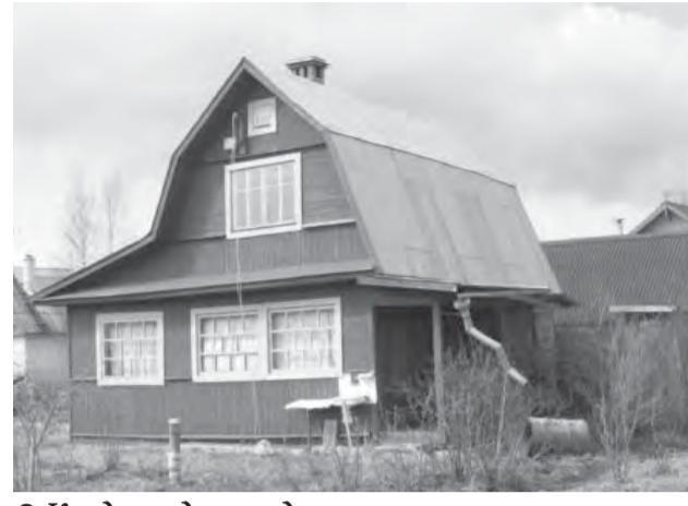
• Когда садовые домики сменяют капитальный дом? Когда сад станет поселком.

В Законодательном собрании Челябинской области прошло совещание по вопросу эксплуатации инженерных сетей садоводческих товариществ.