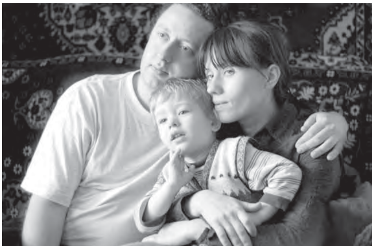
Наиболее распространенный вид отдыха среди россиян – «телесмотрение»...

Неделя детской книги в детской библиотеке №4 была насыщена целым рядом разнообразных праздников и встреч. Воспитанники всех близлежащих детских садов и школ смогли отправиться в увлекательное костюмированное «Путешествие в страну веселого детства».