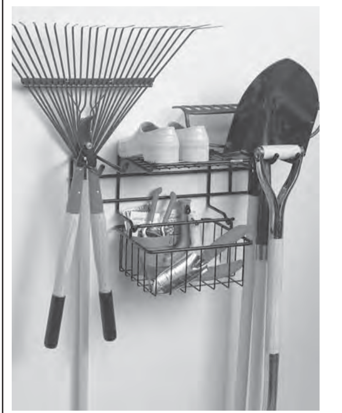
• Инструмент в саду – первое дело!

Тем, кто не один год содержит дачный участок или пригородный дом, давно известно, сколько всего необходимо для благоустройства территории, садово-огородных работ, а также ремонта имеющихся сооружений. Ориентировочно ручной инструмент можно классифицировать следующим образом: орудия для обработки почвы, обрезки растений, уборки, складирования, поливки и ремонта. Хотя такое деление весьма условно, ведь некоторые инструменты многофункциональны.