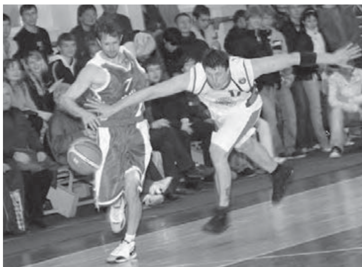
•Магнитка сыграла жестко, но уступила.