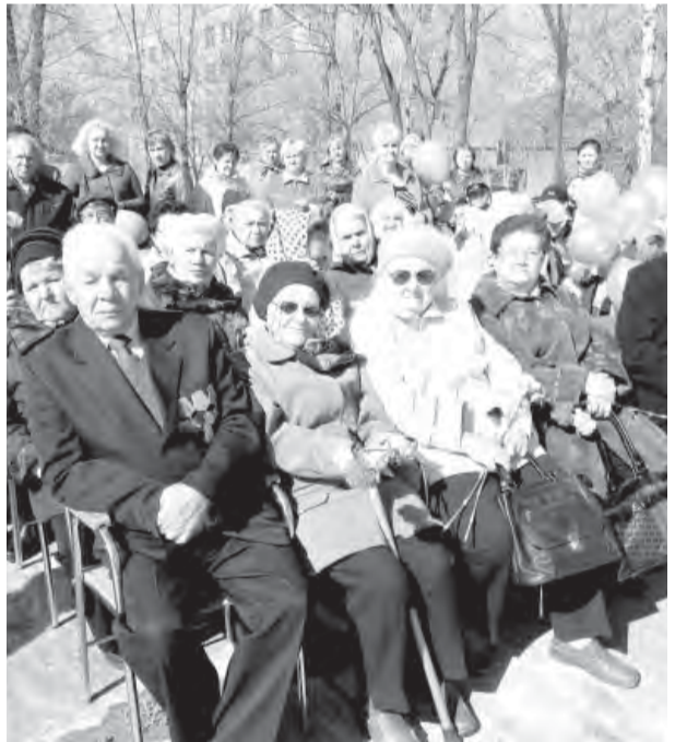
● Момент торжества.

У Вечного огня памяти павшим в войну железнодорожникам возлагали венки, цветы предприятия железной дороги, образовательные учреждения и жители поселка. Собравшихся приветствовали глава Ленинского района В.В.Чуприн, руководители ОАО «РЖД». Концертную программу подготовили творческие коллективы МУК ДК «железнодорожников».