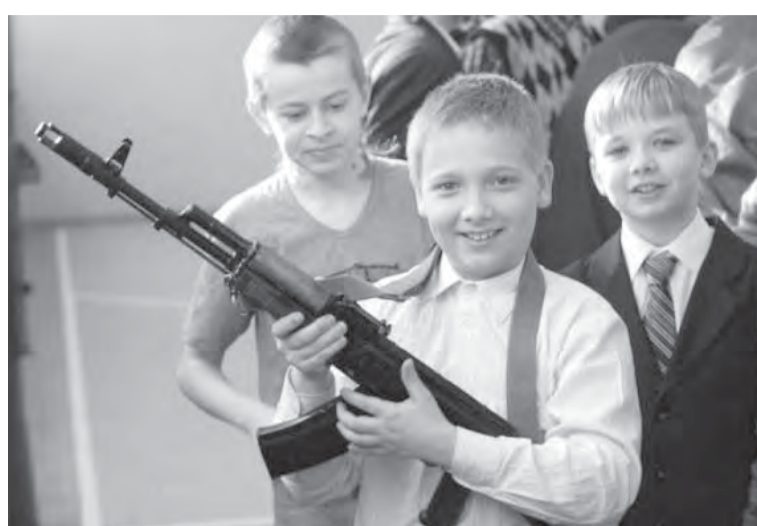
• Возвращение НВП: «за» и «против».