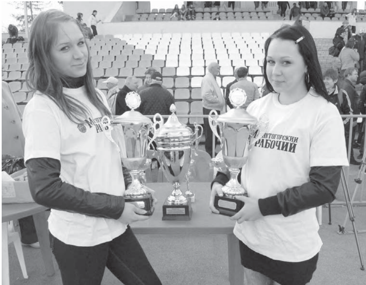
• Праздник украсили красавицы из волонтерской бригады.