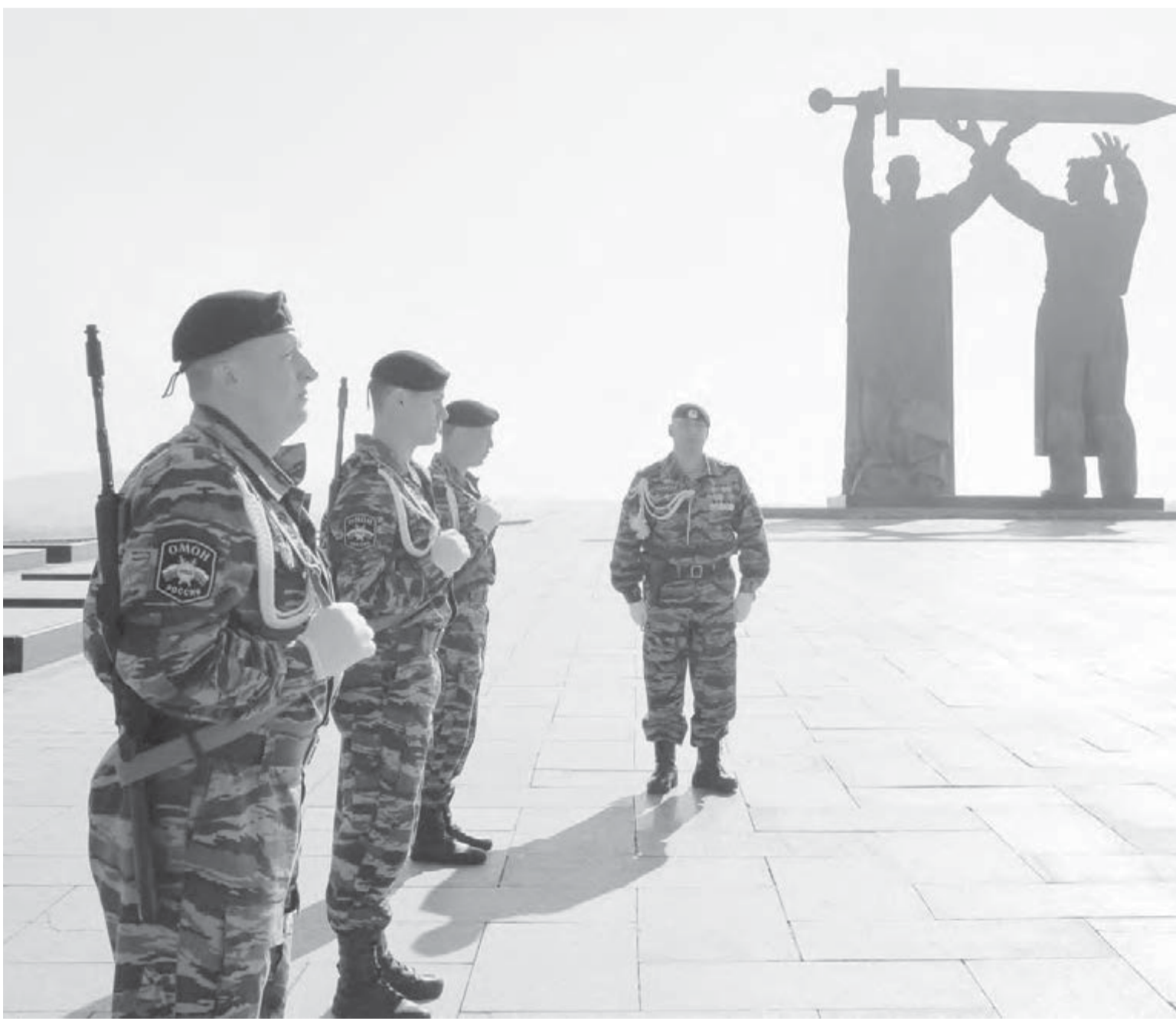
● 9 Мая 2011 года. Минута молчания.