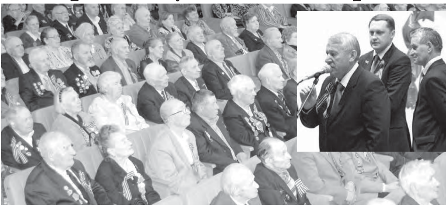
Здоровья вам, ветераны! С Днем Победы!