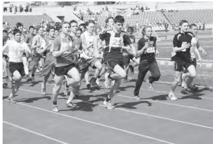
• Эстафета на призы «МР» стартует уже 77-й раз.

Приглашаем команды различных учебных заведений, учреждений, предприятий, организаций, спортивных коллективов и федераций принять участие в открытии летнего спортивного сезона — главной эстафете города. Заявки подаются в мандатную комиссию, которая работает в СДИУС-ШОР № 1, расположенной на территории Центрального стадиона (западная сторона): ул.Набережная, 11/1. Телефон для связи: 26-67-96.