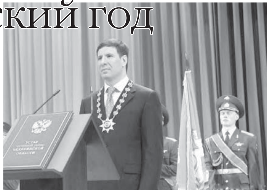
● 22 апреля 2010 года состоялась инаугурация губернатора Михаила Юревича.

О том, чего не удалось сделать за первый год работы, сам Михаил Юревич также рассказал. Губернатор недоволен состоянием регионального бюджета во время кризиса. «Не сделано было то, на что денег не хватило», – говорит глава региона. Однако, по его словам, за прошедший год южноуральский бюджет стабилизировался, что позволяет рассчитывать на позитивные перспективы региональной экономики. Еще одной проблемой губернатора назвал запущенность малых городов, районных центров и поселков Челябинской области. «В некоторых