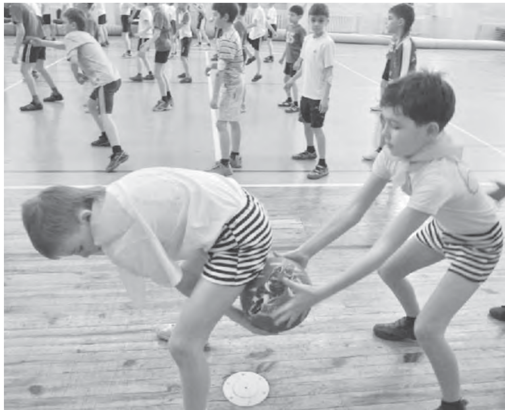
● Раста ловкими, быстрыми, смелыми.