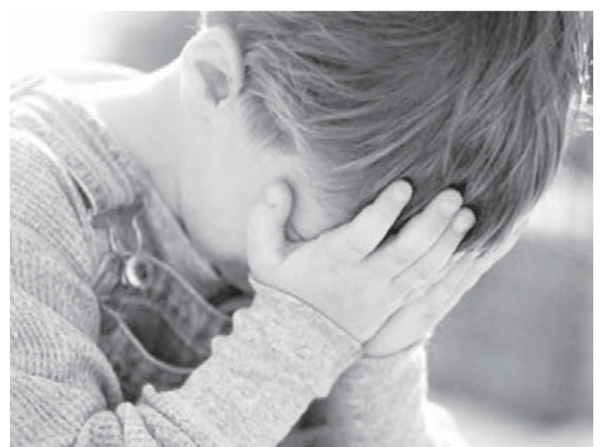
● Депрессия у детей — возможно ли это?

Родитель должна насторожиться и волнообразная успеваемость — от положительных оценок к двойкам и наоборот, а также предневрологическое состояние ребенка. Когда у