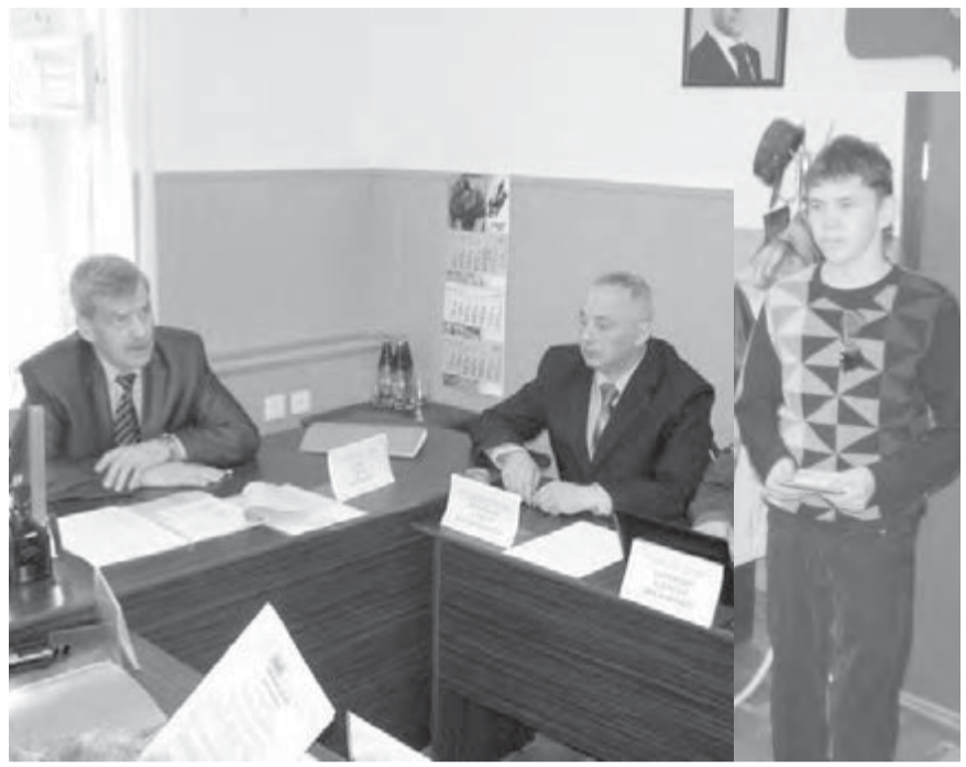
● На призывной комиссии.

В декабре прошлого года утвержден «План совместных действий отдела военного комиссариата Челябинской области по Орджоникидзевскому району (г. Магнитогорск), управления внутренних дел и органов федеральной миграционной службы по розыску граждан, уклоняющихся от исполнения воинской обязанности и обеспечению их прибытия на мероприятия, связанные с постановкой на воинский учет и призывом на военную службу в 2011 году». В районе создана оперативнорозыскная группа из представителей отдела военкомата и управления внутренних дел по розыску граждан, уклоняющихся от воинской обязанности. К административной