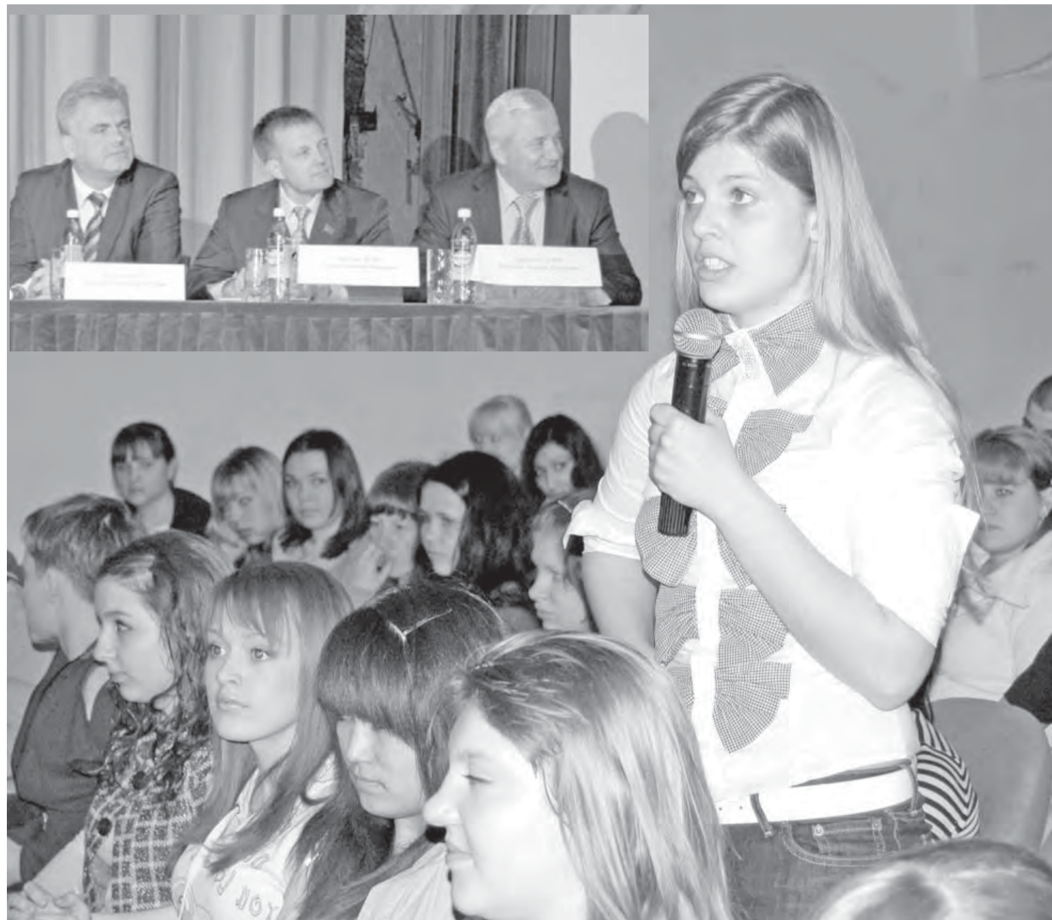
● Урок парламентаризма для школьников.