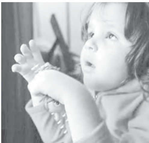
● Законодательно в России права аутистов не учтены...

«Многих аутистов исключают из школ, – рассказывает председатель общественной