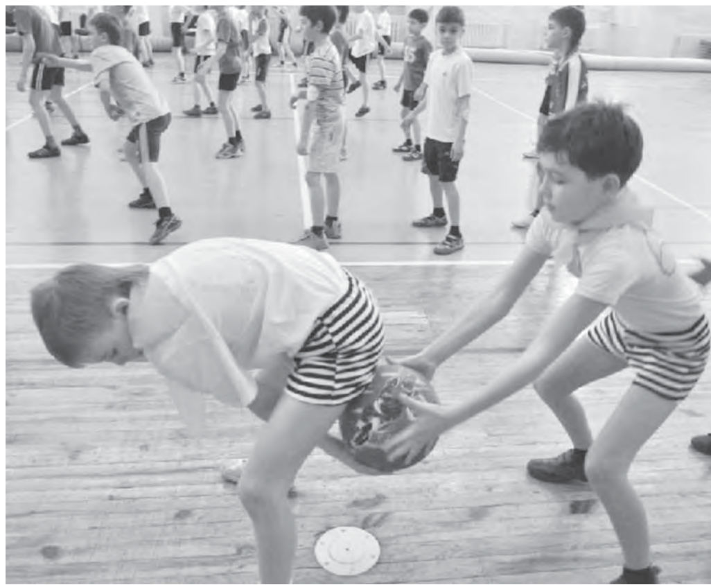
● Расты ловкими, быстрыми, смельчачи.

Напряженная борьба развернулась уже с первых минут. Каждый стремился стать лучшим.