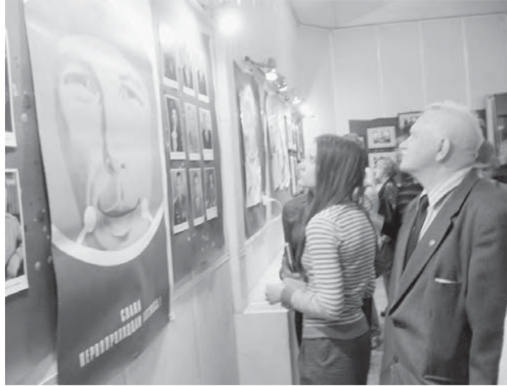
Перед портретом Гагарина останавливается и стар, и млад.