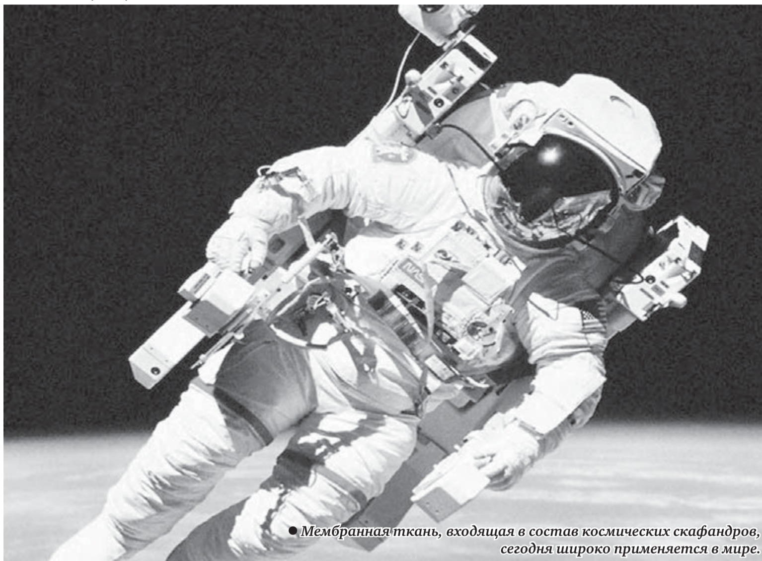
● Мембранная ткань, входящая в состав космических скафандров, сегодня широко применяется в мире.