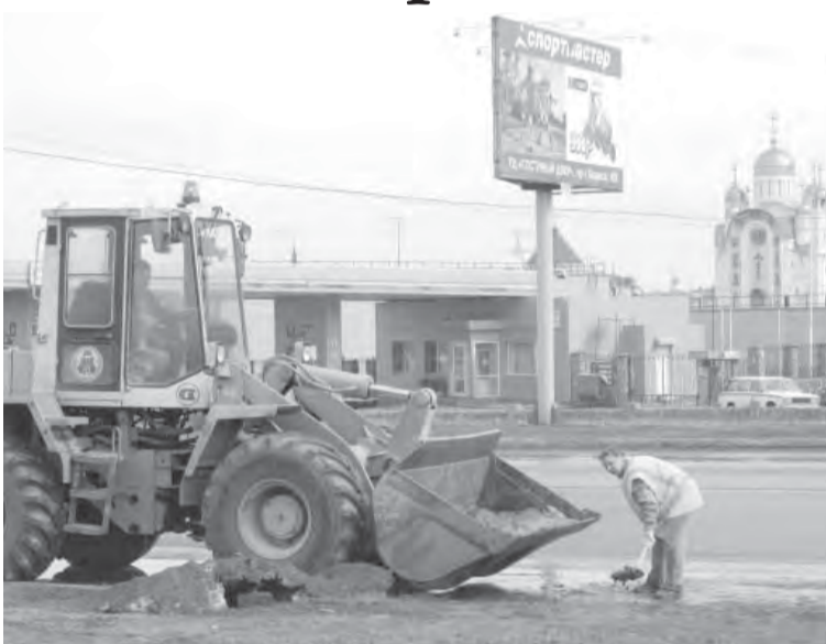
● На снимке П. Косолапова: начаты работы на перекрестке пр. Ленина – ул. Завенягина.

том, что в 2011 году из городского бюджета на эти цели будет выделено не менее 400 млн. рублей, еще 100 млн. ожидается от инвесторов.