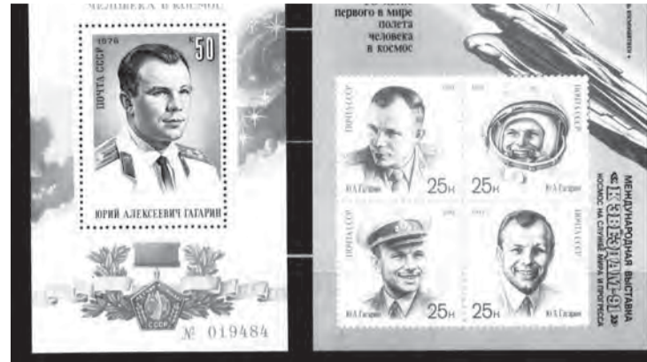
«Космическая» тема была самой популярной в 1961 году – и не только.

Гагарин популярен и в наши дни. Начиная с 1992 года в Российской Федерации выпущено пять марок, посвященных этому человеку, а по повторяемости он на третьем месте после Петра I и Пушкина. К 50-летию первого полета в космос издательско-торговый центр «Марка» подготовил номерной памятный блок с портретом первого космонавта. Номинал блока 50 рублей, тираж – 130