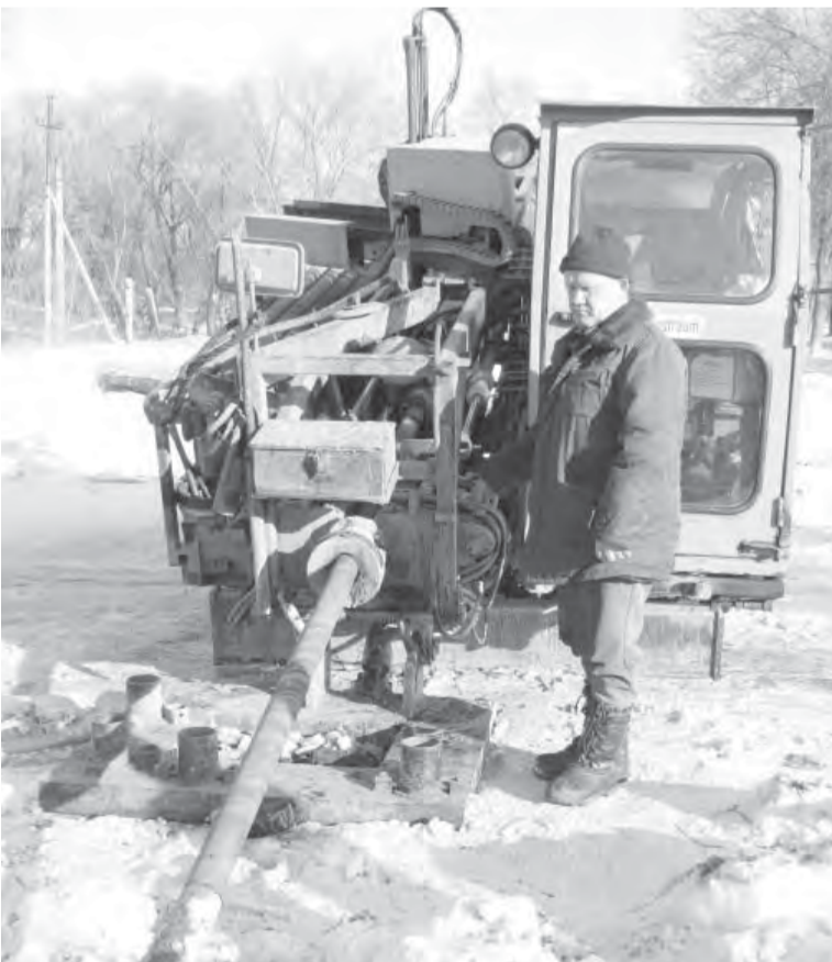
Машина для наклонного бурения в действии.

На втором этапе – замена наиболее аварийного участка в районе станции Ежовка. И на третьем, заключительном, этапе