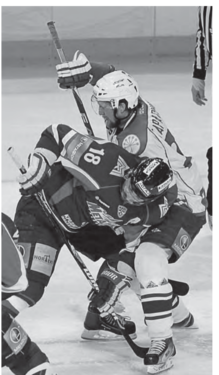
«Металлург» - последняя игра сезона.