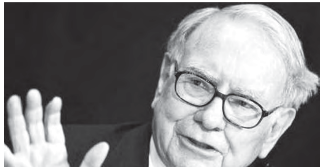
• Зрелый возраст - умный возраст.

Что касается забывчивости, то, по мнению ученых, она вызвана обширными знаниями и накопленным опытом взрослого человека, «оперативная память» которого наполнена многочисленными фактами. В результате быстро «выудить» их из огромных информационных объемов для пожилого человека не так просто, как для не обремененных знаниями юноши, отмечают нейробиологи.