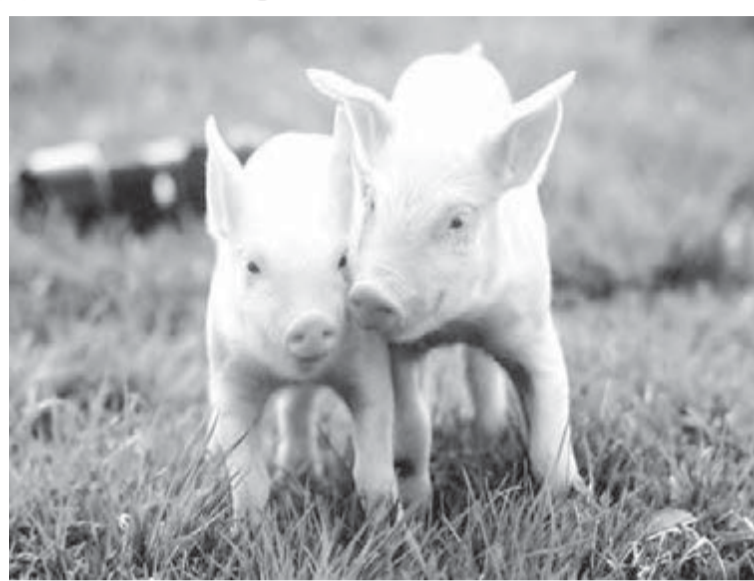
Минсельхоз готов встать на защиту отечественных хрюшек от африканской чумы.

Еще один «наказ» министра регионам – выполнять план мероприятий по предупреждению распространения вируса африканской чумы свиней.