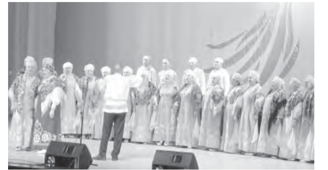
• На сцене фестиваля.

Придается особое внимание вовлечению пенсионеров в ветеранское движение. В городе 548 первичных организаций. Каждый четвертый житель состоит в одной из них.