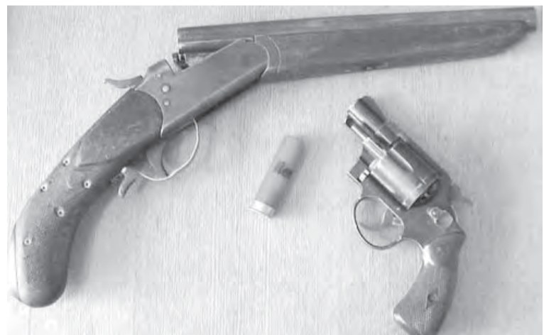
• А может, поискать старушку с обрезом?