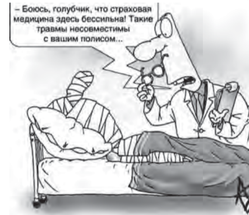
– Боюсь, голубчик, что страховая медицина здесь бессмысленна! Такие травмы несомненно с вашим полисом...

На сайте ЧОФОМС можно найти и полный перечень страховых медицинских организаций, а также адреса всех пунктов выдачи полисов на территории