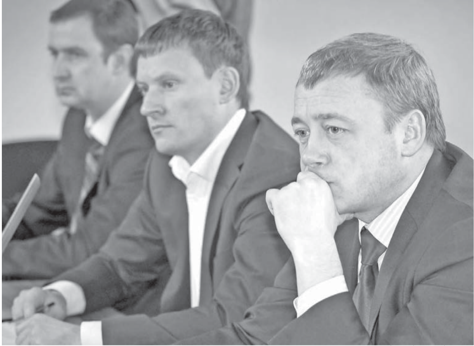
● В зале заседаний горсобрания.