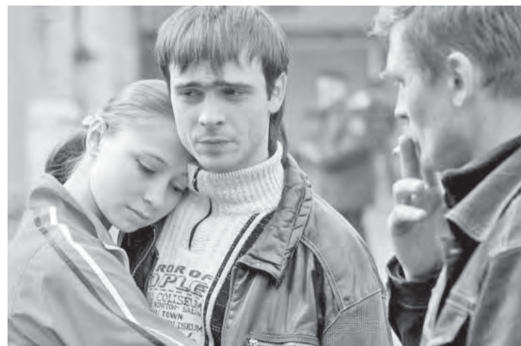
• «На позицию девушка провожала бойца...»

На недавней коллегии Минобороны президент Дмитрий Медведев поддержал предложение военного ведомства по со-