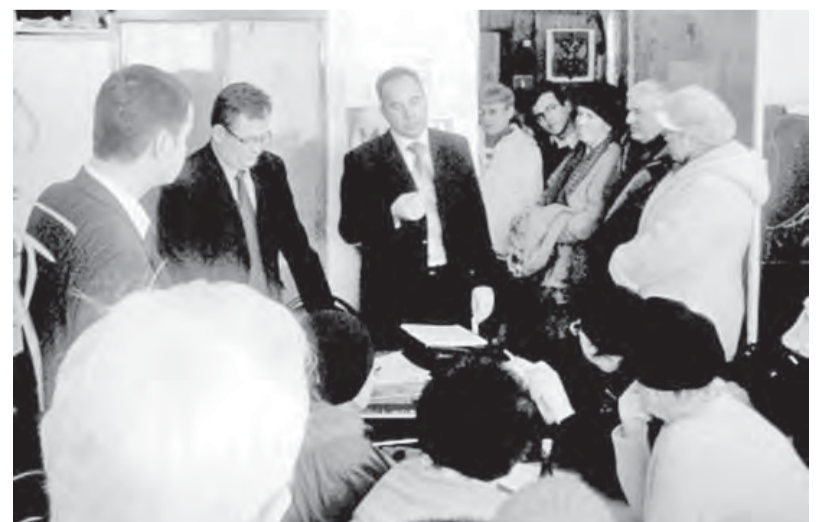
• На собрании активистов 112-го и 113-го микрорайонов.

Положено начало первому в нашем городе опыту взаимодействия общественной организации с конкретным депутатом по конкретной проблеме, волнующей сегодня большинство населения города.