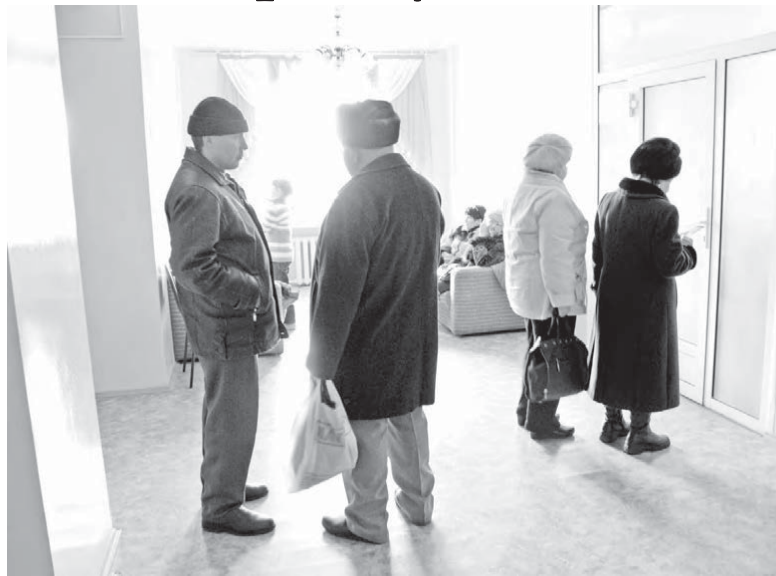
• «День открытых дверей» юристов вызвал интерес горожан.