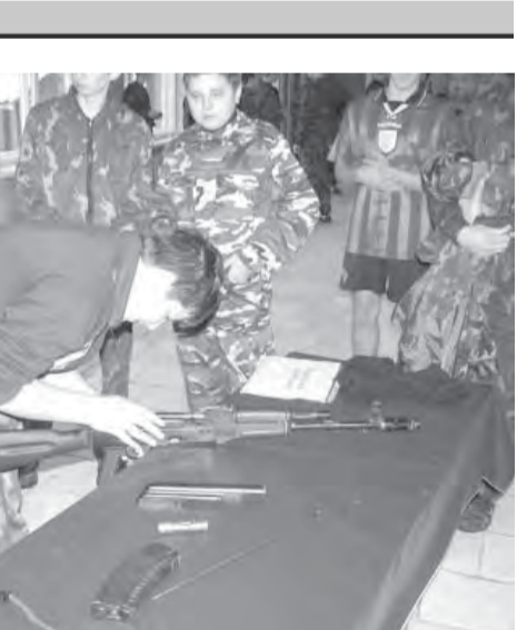
Каждый мужчина должен знать, где лежит патрон...