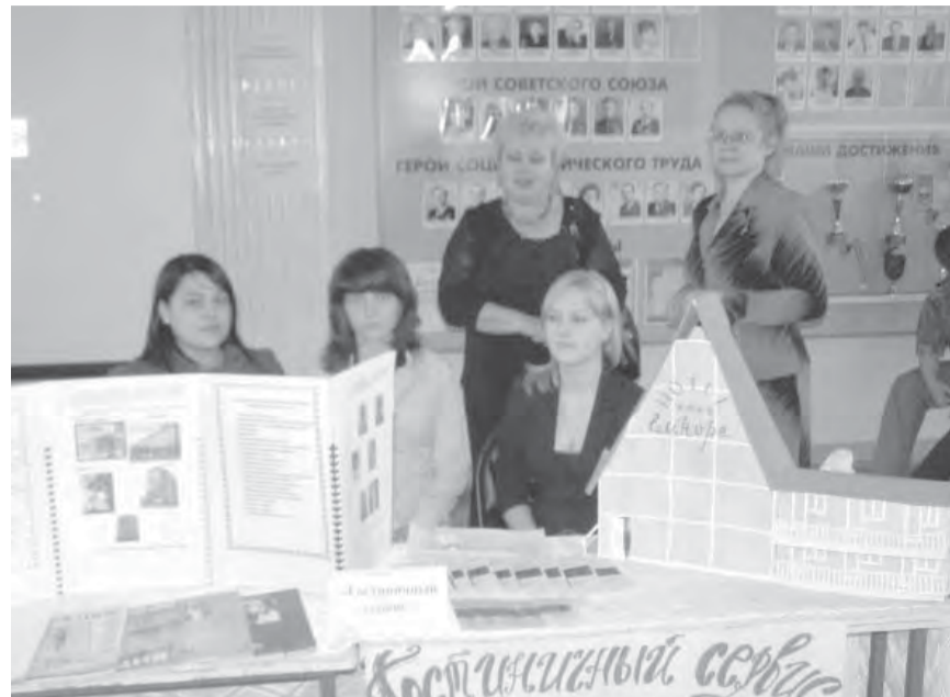
На дне открытых дверей.

За прошедшие годы учебное заведение подготовило 28773 специалиста средней квалификации.