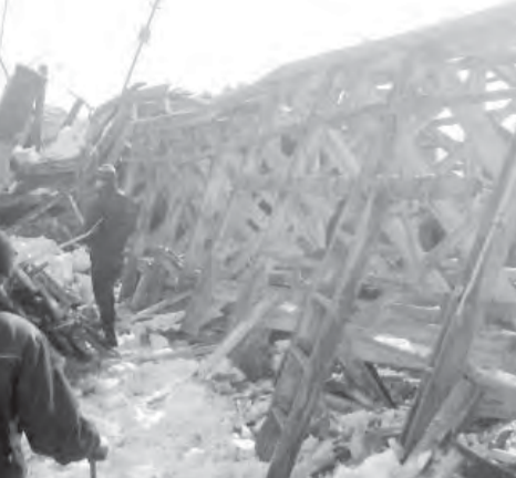
В борьбе со снегом 3:0 в его пользу.

На момент посещения аварийного дома корреспондентами нашей газеты на крыше полным ходом шли ремонтные работы. Часть шифера рабочим уже удалось разобрать. Как только рабочие ливни-